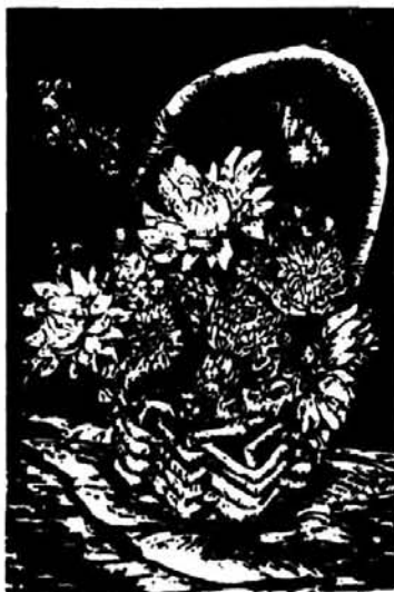
Jakab Csaba: CSENDELET