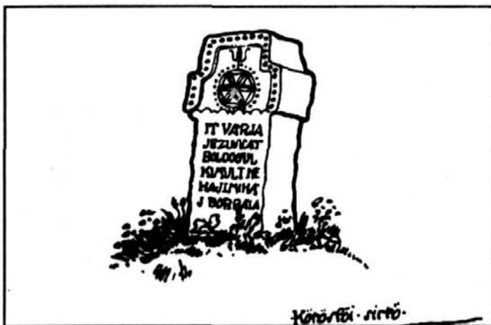
Kós Károly rajza