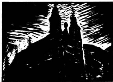
Molnár Dénes: CSÍKSOMLYÓ

Van azonban olyan változat is, hogy nem Szűz Máriának mondják, hanem a Holdra. Így nevezik. Feljövetelekor hozzá imádkoznak, mint reggel a felkelő Naphoz. Mindig kelet felé fordulva. Az emberi léte legnagyobb befolyást gyakorló két égitest nemcsak Erdély címerében látható, hanem mindkettőnek tisztelete még ma is él a föld népében.