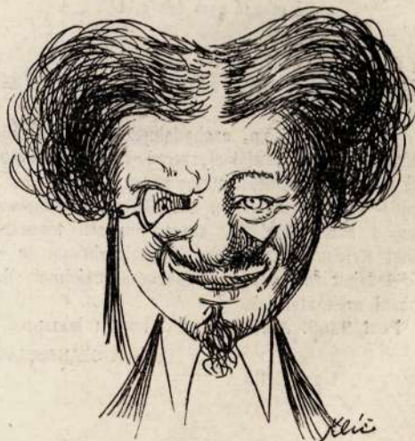
6. Megvan !