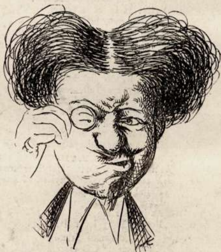
5. Aha !