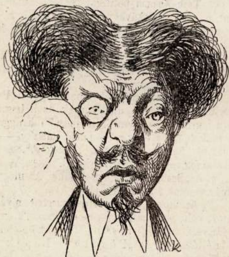
2. No !