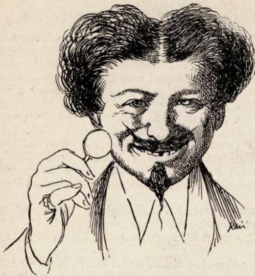
1. Mily szép fogok lenni !