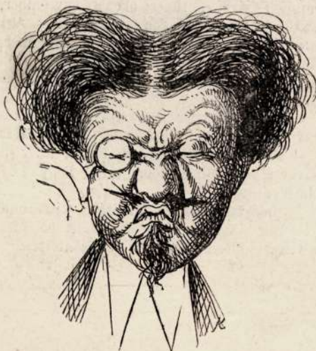
3. Ejnye no !