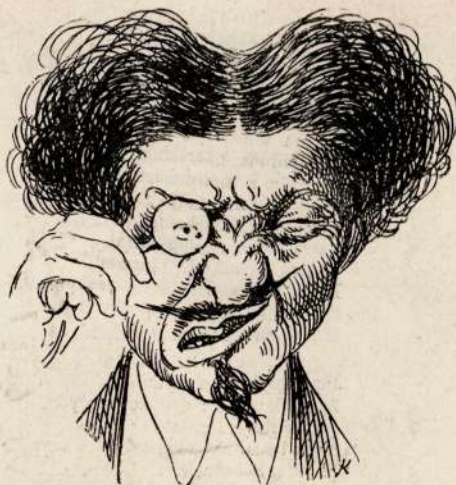
4. Verfluchte Gschieht !