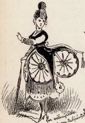
En velocipède. "Plova kankaröst, stivom tubipäntä."