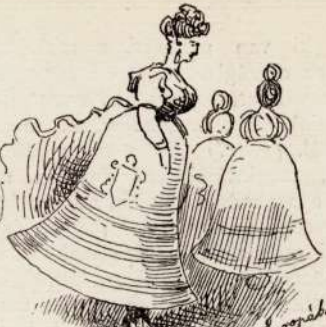
"Korangerin bälke, av europäiska."