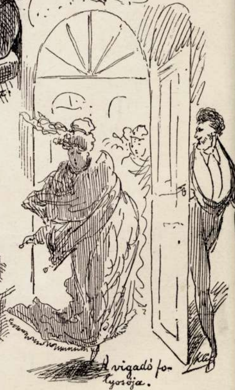
A rigadó folyosója.