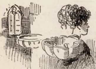
Ki akso räbriuh.