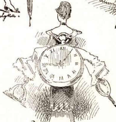
Hány óra, galambom?