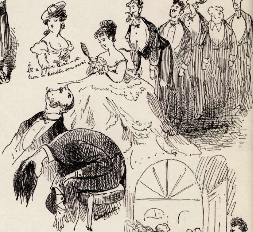
Itt a fejére tenni - ott hon a kezébe som szesi