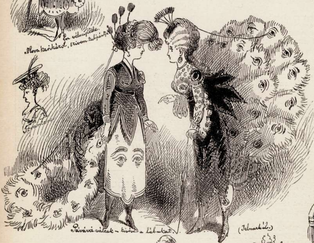
Paviva välsak - kinn a labukat.