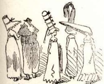
A hova vinnék.