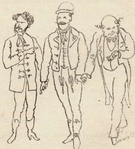
IV. Megtörtént. A katonából polgár lett. Így van ez jól.

NB. Ha ez a gondolat az „Üstökös“-ben véletlenül nem így volna illusztrálva hanem megfordítva : úgy erről sem az igazság sem a józan ész nem tehet.