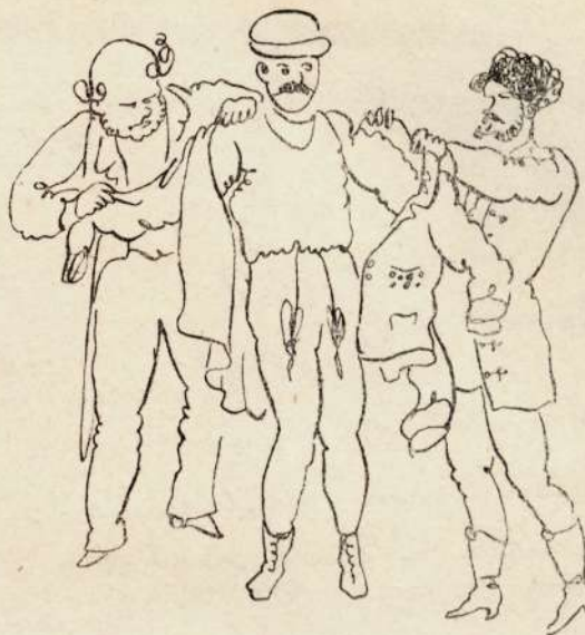
II. Lehúzzák róla a kétféle posztót és bő ujjast adnak rá.