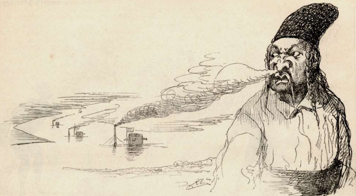
Csavarja az orrodát, fratyé, a magyar Monitorulu füstje?