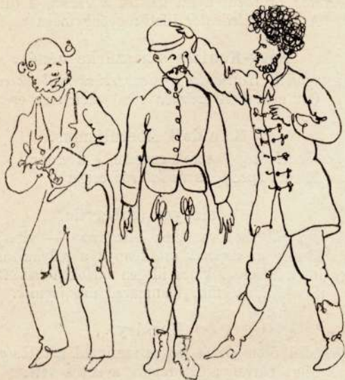
I. Leveszik fejről a csákot és kalapot tesznek helyébe.