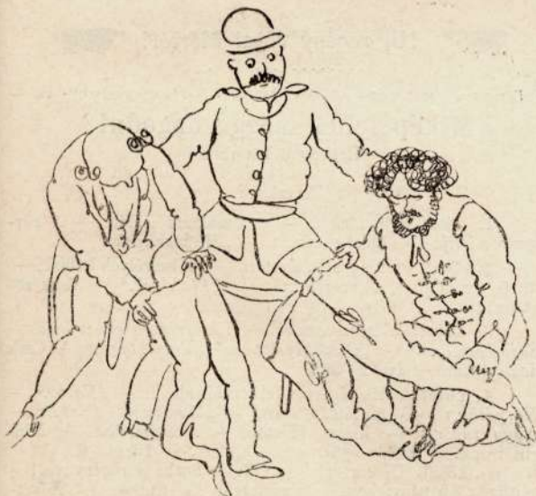
III. Az egyik lábával a katonasorból kilép, a másikkal a polgáriba belép.