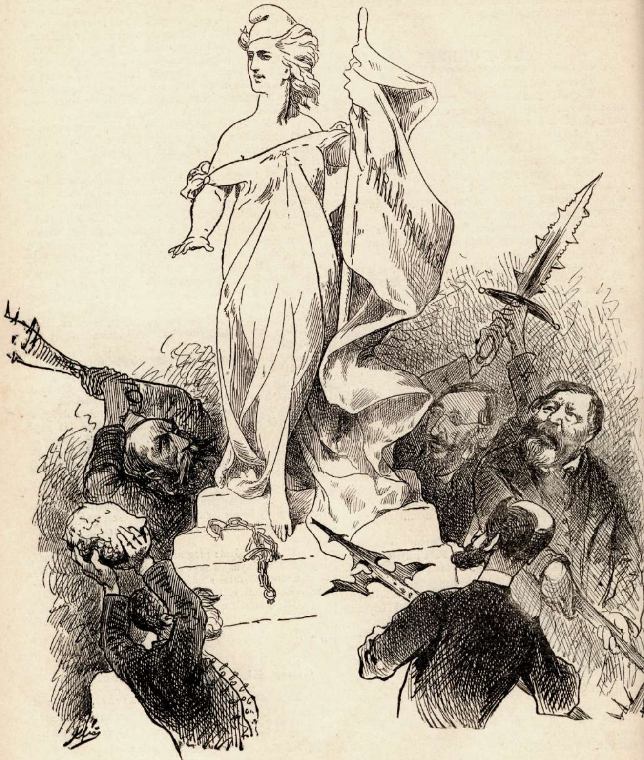
A szabadság eszményét ódon vármegyei fegyverekkel támadják meg.