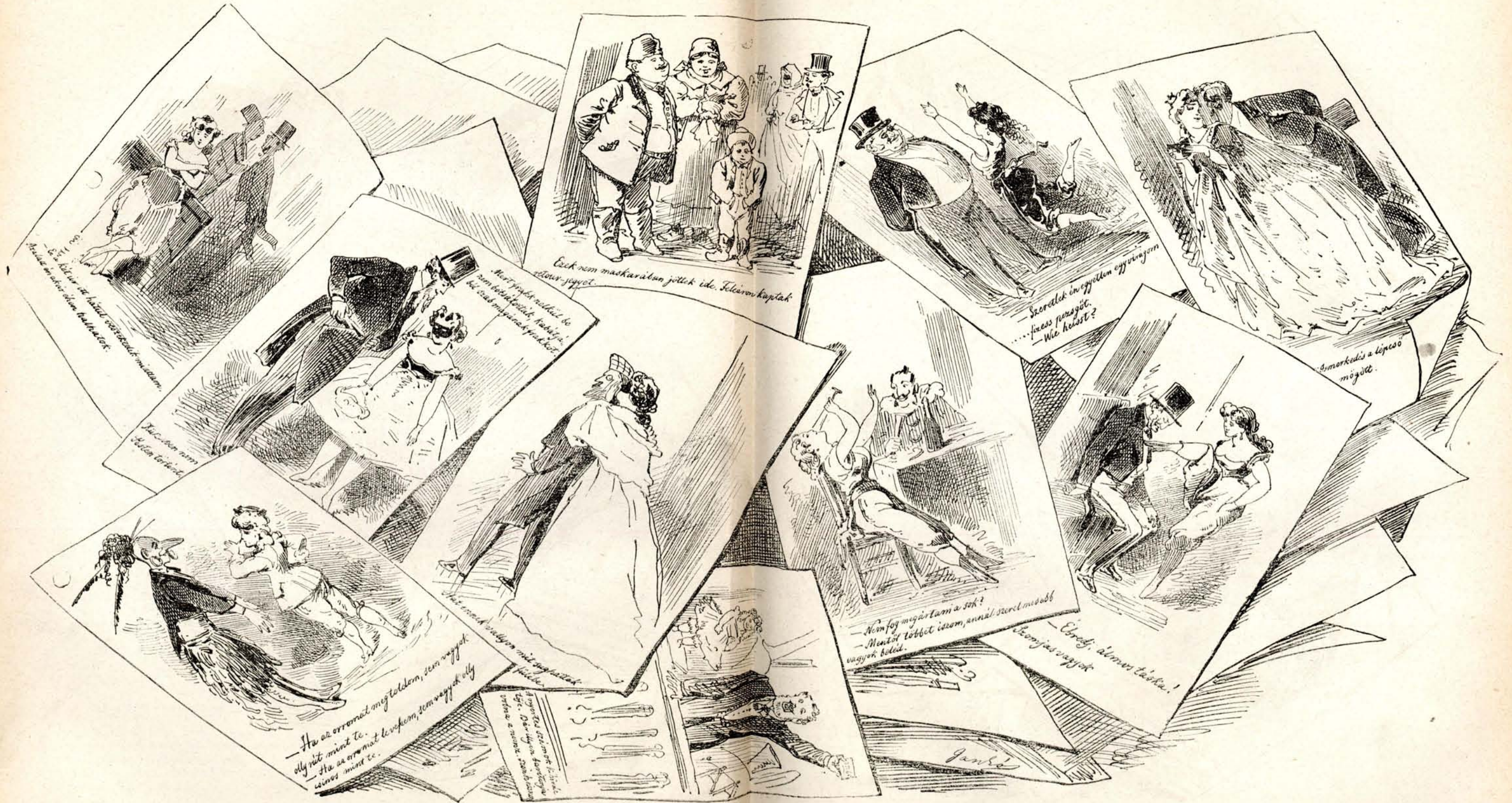
— Ez kétféle az a házid szőnyegnek minium. — Ha az orromat meg toledem, sem vagyok oly rit mint te. — Ha az orromat levehem, sem vagyok oly csinos mint te.