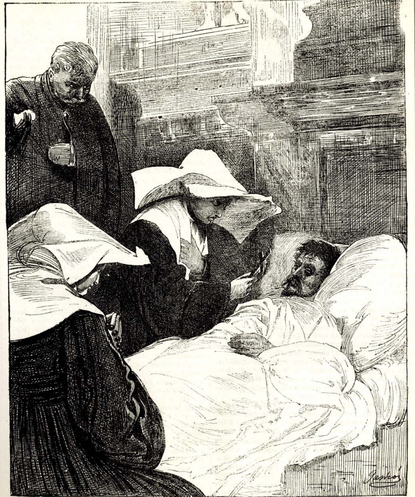
MORITURI TE SALUTANT.