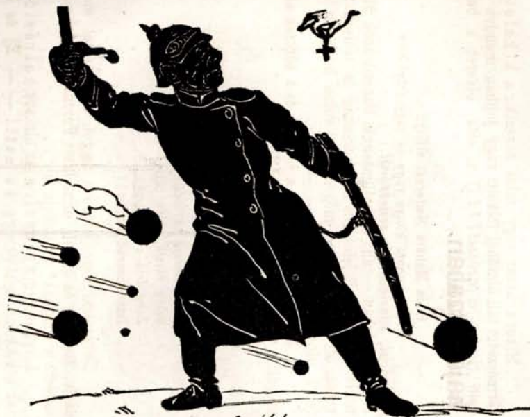
Harcolt, és kapott vas-keresztet.