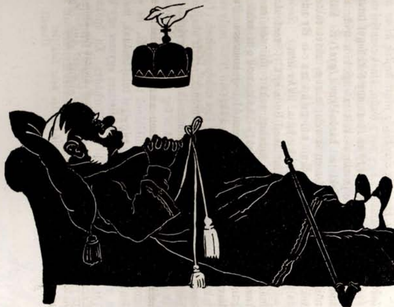
Aludt, és nyert császári koronát.