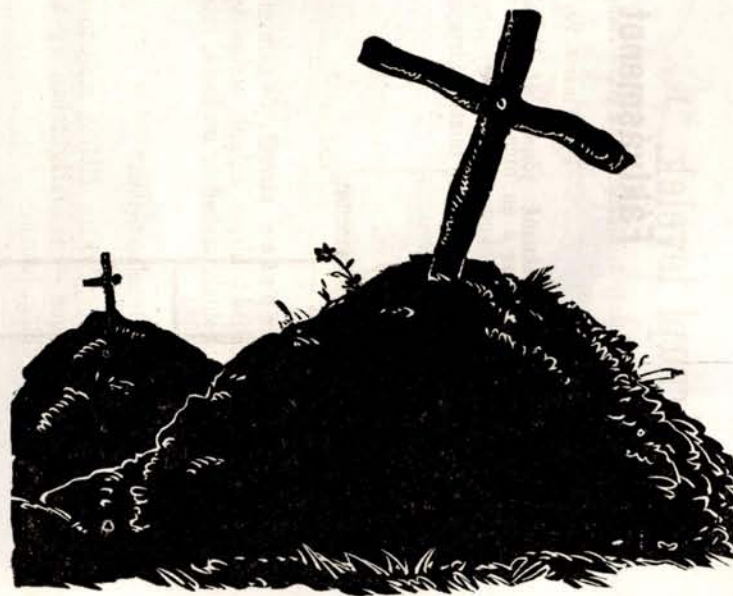
Elesett, s kapott fa-keresztet.