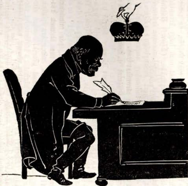
Irt, és nyert hercegi koronát.