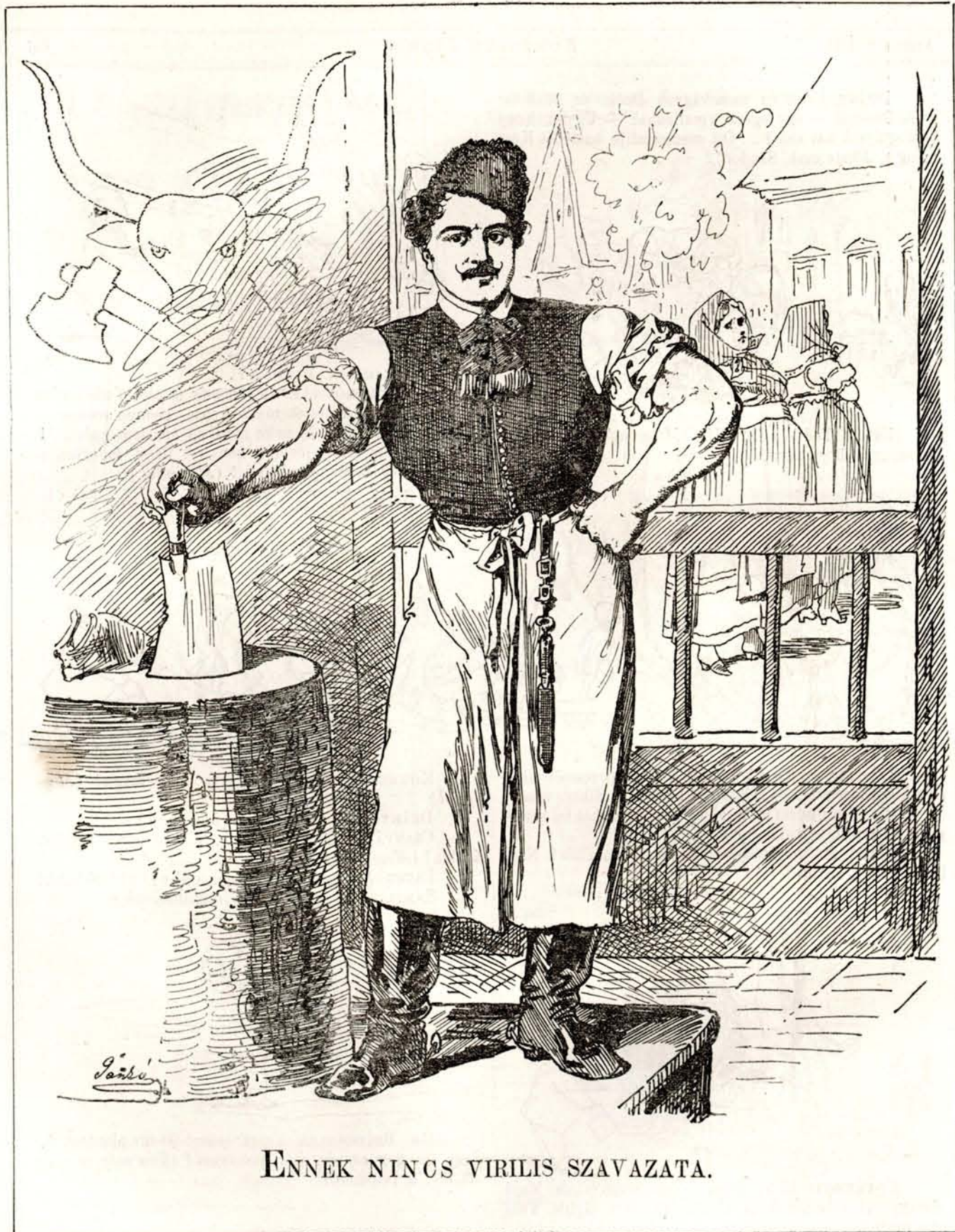
ENNEK NINC S VIRILIS SZAVAZATA.