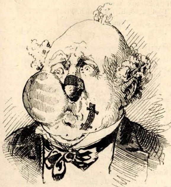
Ez a baron Rothschild.