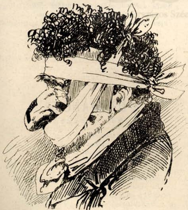
Ez a ritter von Trattenreiter.