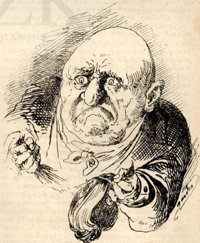
Ez a baron Schey.