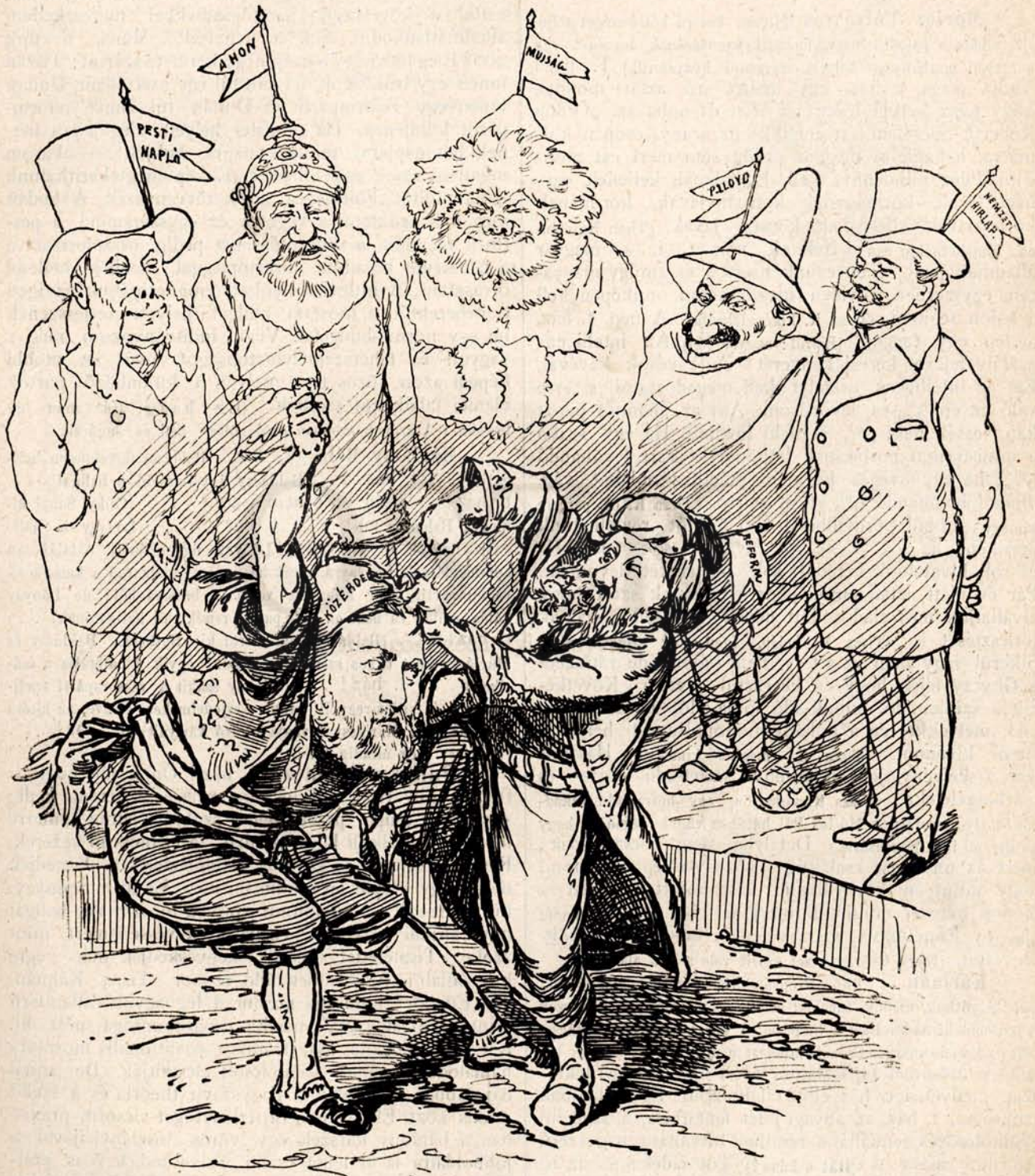
A nagyhatalmak minden várákozására ellenére, Montenegró és Törökország között mégis kiütött a háború.