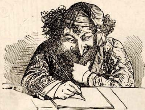
Bodapescht, 20-ik marcziusba.

— Seifensteiner Salomonhoz, a sógoromhoz, a botoshoz a három dob otczába. —