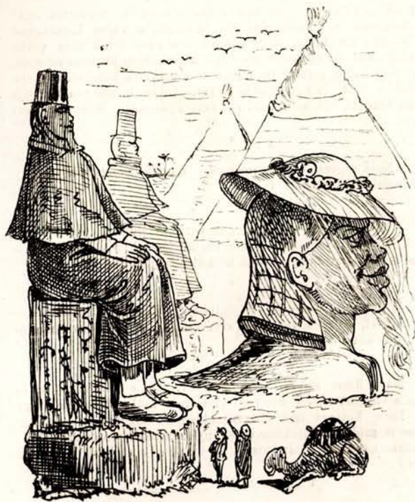
A sphynxek és gulák szintén angolosan reformálódnak.