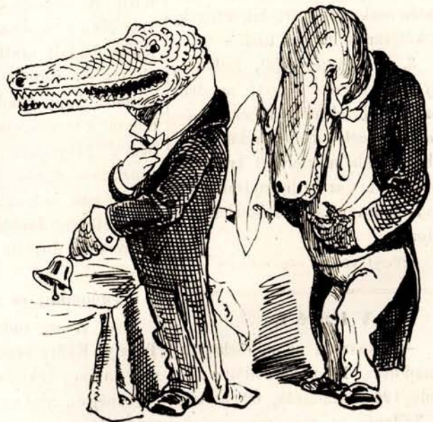
A kaimánok, alligátorok és egyéb krokodilusok, ismeretes könyveket hullajtva, állatvédelemért folyamodnak.