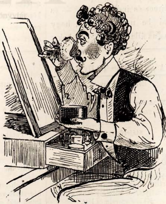
Pacsmaghy Bandi ügyesen színezett.