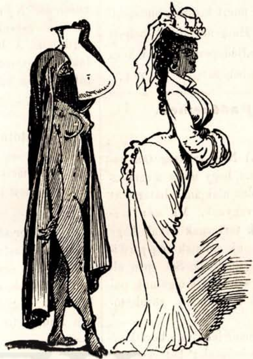
Az arab rabszolgából pedig miss Arabella néven lesz szabad hölgy.