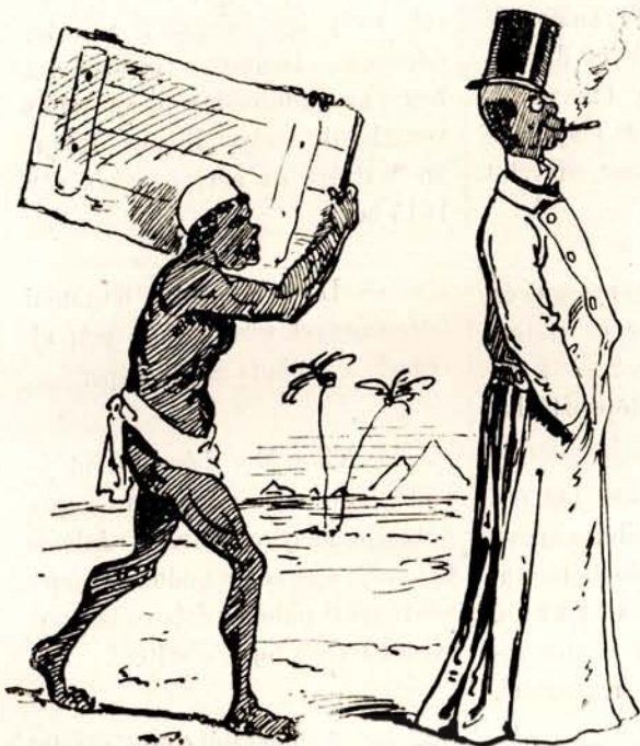
A núbiai Daud gentlemanné lesz és Davidson nevet vesz föl.