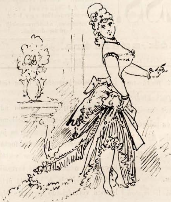
Cuszányi Csipetke k. a. helyes fölfogással játszott.