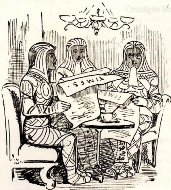
A mumiák comfortable módon élnek ezentul a piramidosok gyomrában.