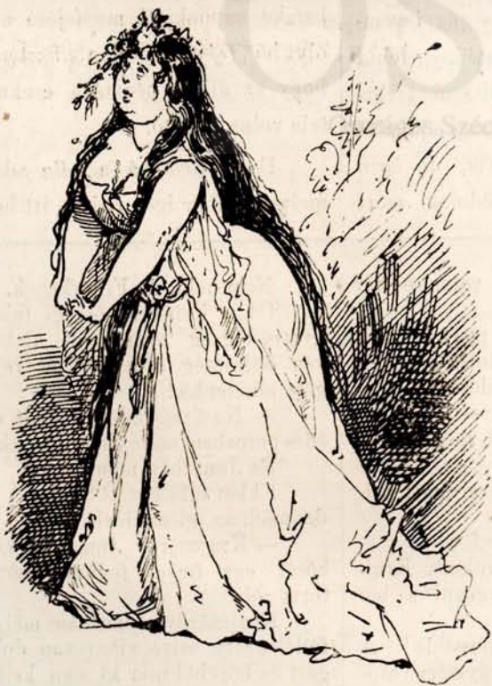
Hájbáji Szalonka asszony kereken kidomborodó alakítással örvendezteté meg a házat.