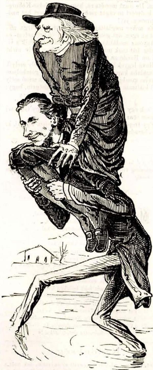
Albertus a Franciscust.