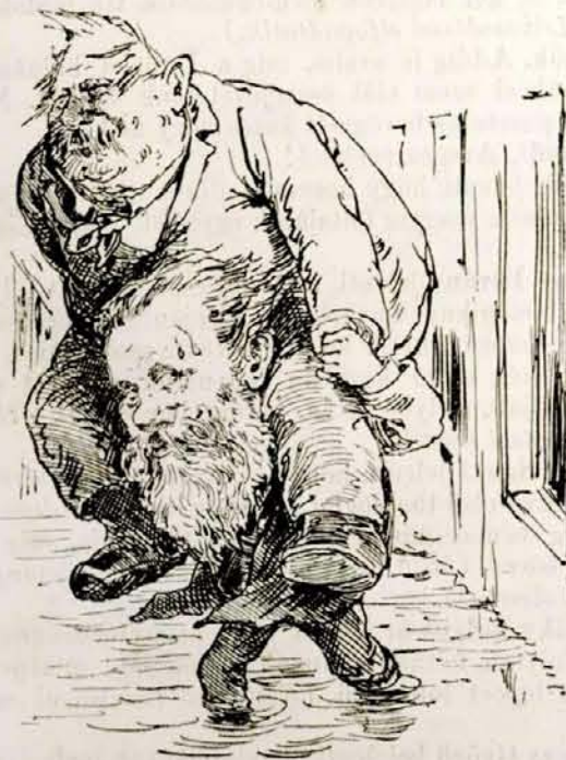
Ernő az ő báróját.