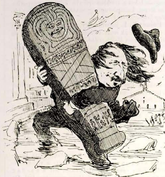
Pulszky az ő múmiáit.