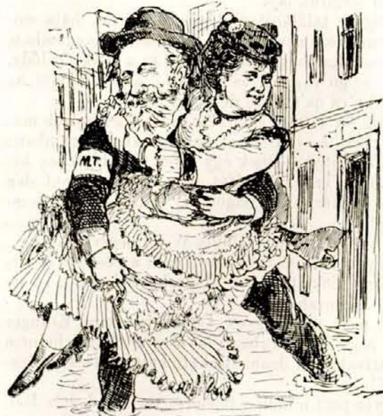
Rákosi az ő tallérszerző péknéjét.