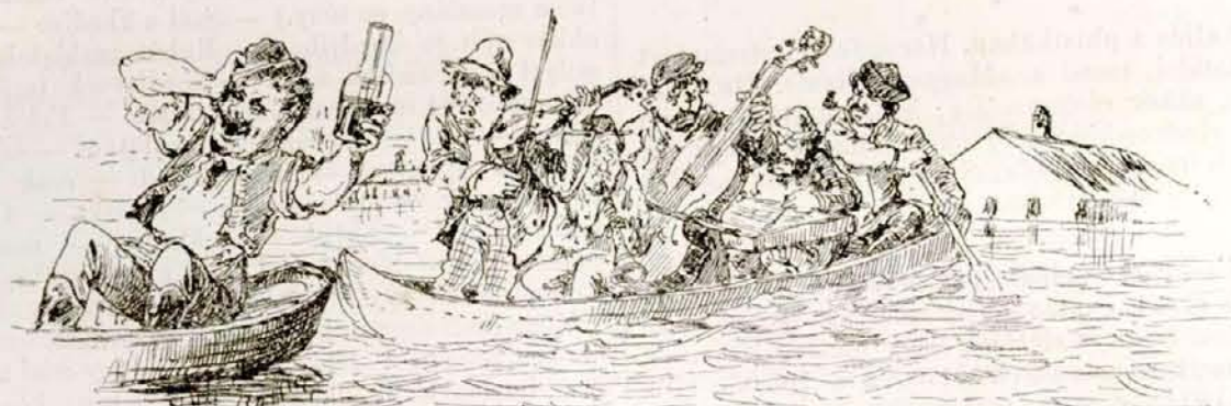
„A dunamenti legény” pedig így muzsikáltatja most magát »utezahosszat«.