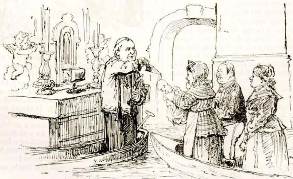
A vizi-városi plebániában így keresztelnek.

Igazgató. Azoknak kérem itt kell maradni. Ki vigyázzon a gyárra?