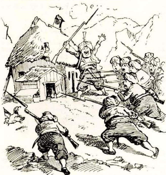
A fölkelők egyik félelmes erődjét fényes bravúrral bevettük. Masallah!