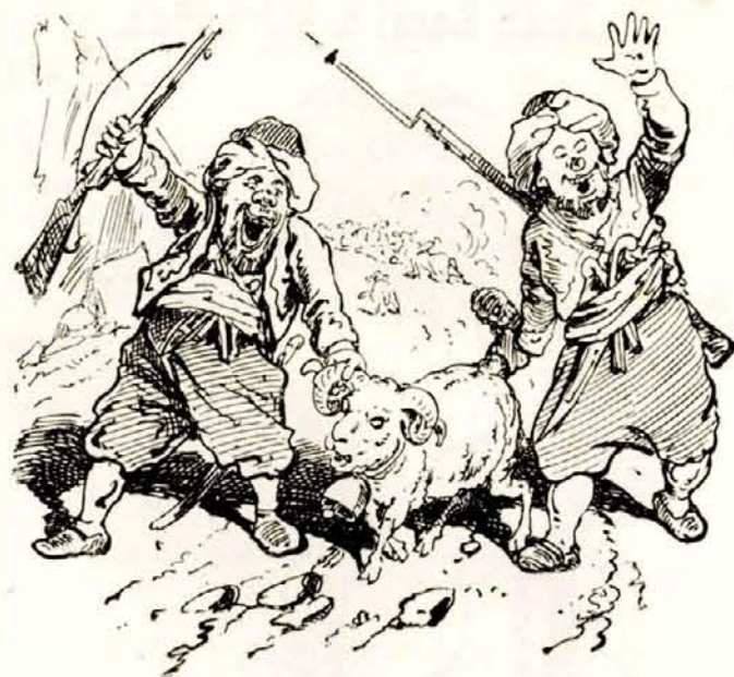
Sőt a vezért is elfogtuk. Allah il Allah!