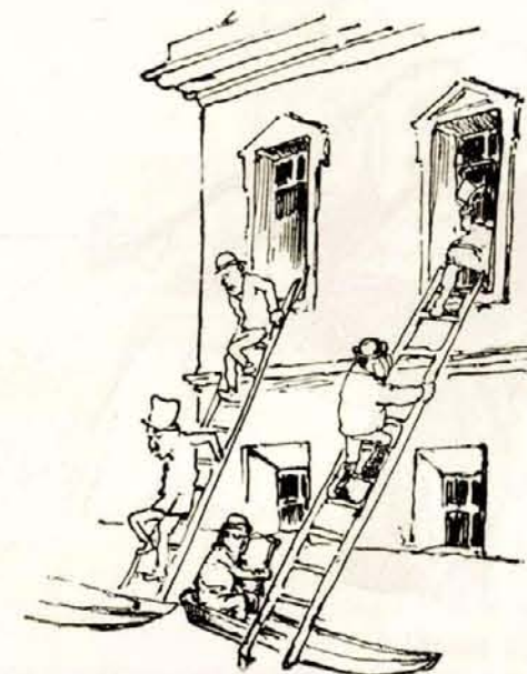
»Dr. Ipecacohn rendel naponkint, d. u. 2—4-ig.«