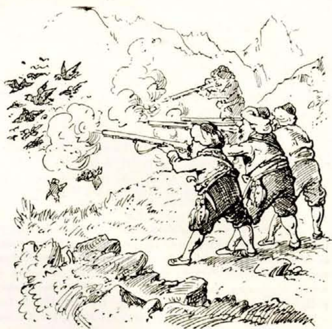
Számos foglyot ejtettünk. Masallah!