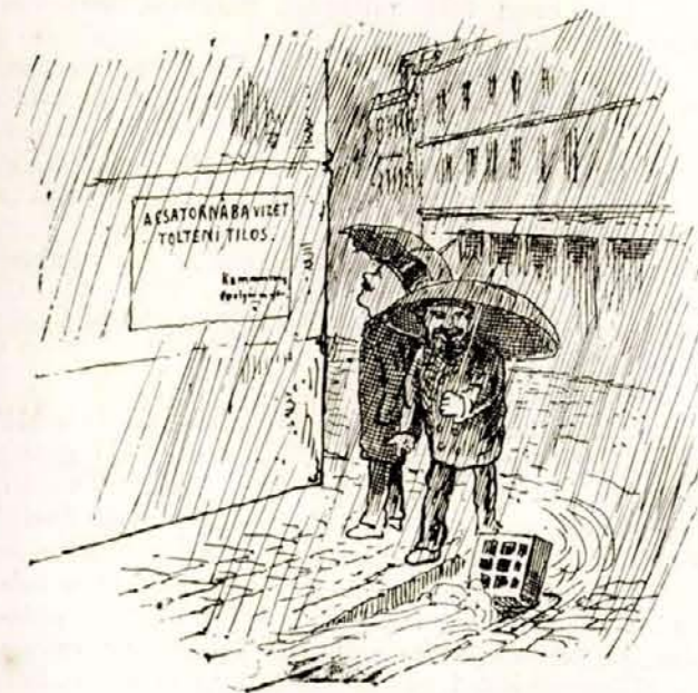
Szerencse, hogy az a Jupiter pluvius nem budapesti polgár, különben egy pár olympusi forintban elmarasztalnák.