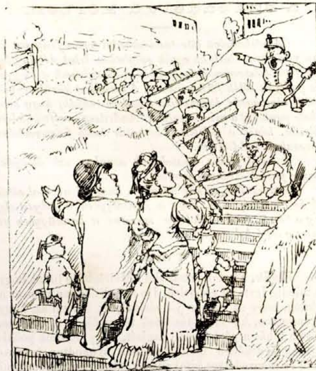
Várhegy oldalában viszen föl jó grádics. Mit ér: ha tekintet, ő közönség, rád nincs? Épen mikor lépne uri család rája, — Elhordják a hauptmann harsogó szavára.