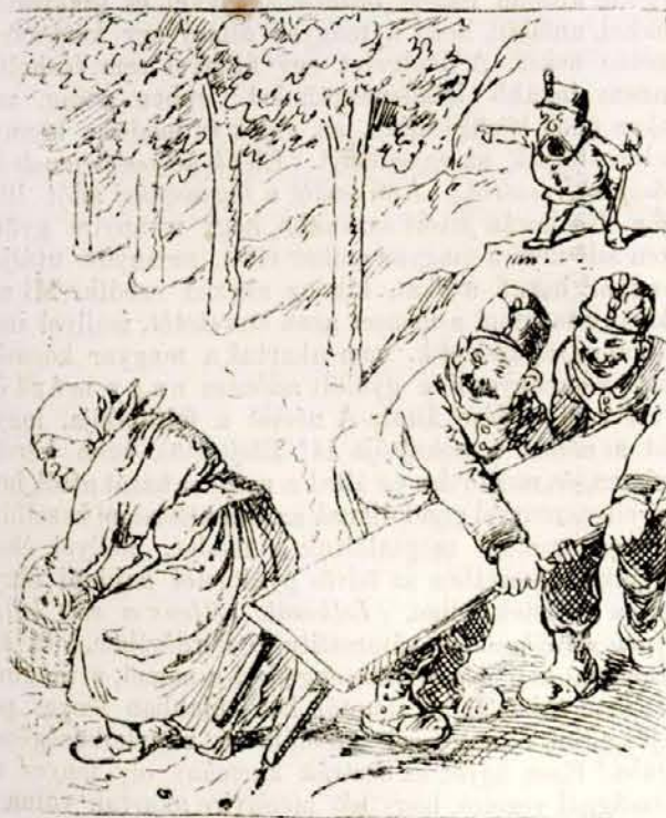
Várhegy oldalában jó pihenő padka, Fáradt öreg asszony kipihenne rajta. Hanem éppen hogy rá ülne nyugovóra: Bontják-viszik onnét, hős kommandó-szóra.