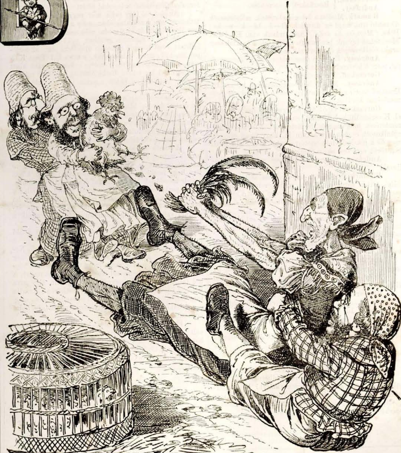
T—A K—N. Még sem lett övök az egész!