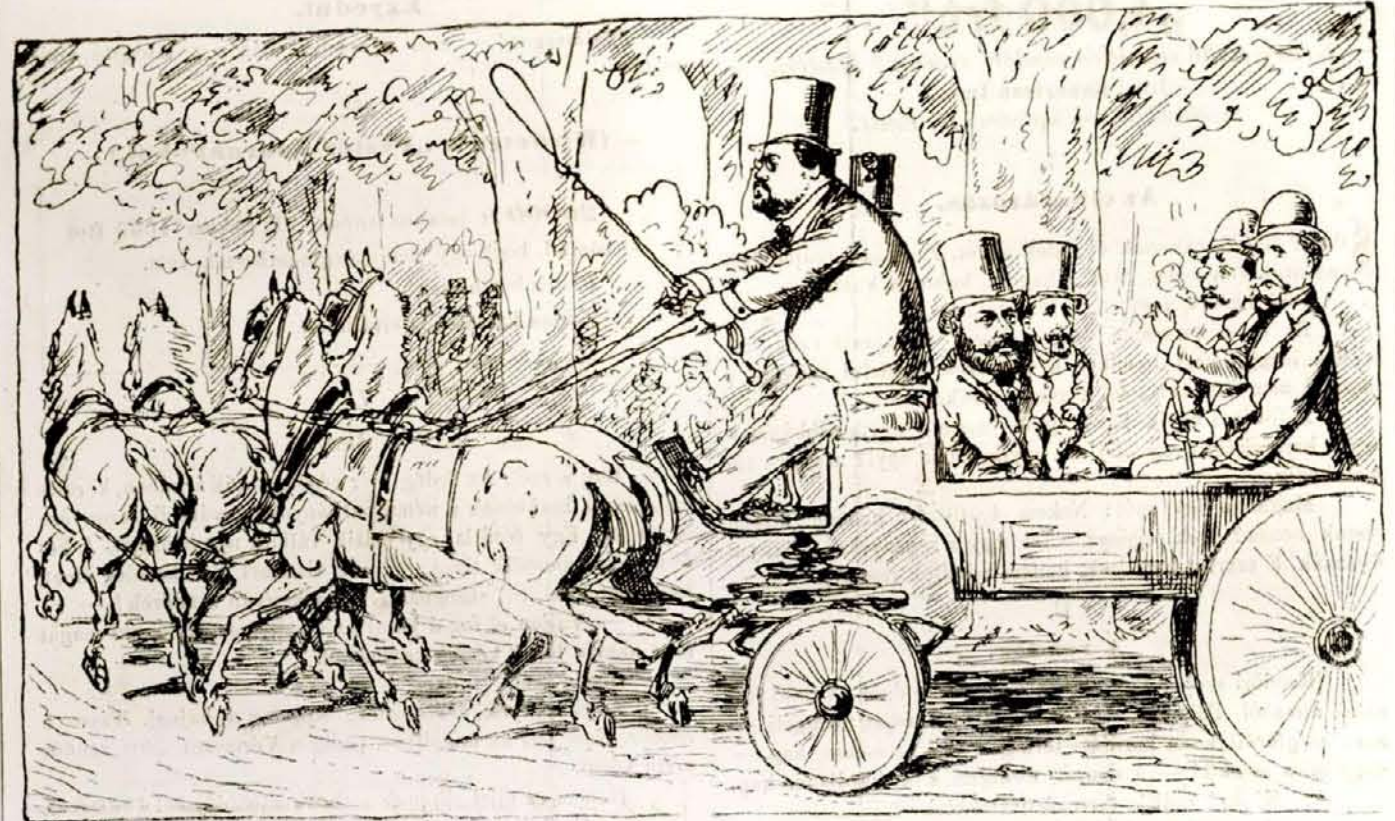
Elöl hátul négyes fogat.