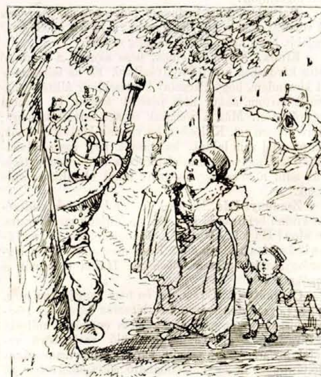
Terebélyes fákat látsz ott akár hányat, Dada megy alájok keresni az árnyat. Hogy alájuk lépne — dörög a szó: „hapták!” S a katona bácsik a fát kivagdallják.