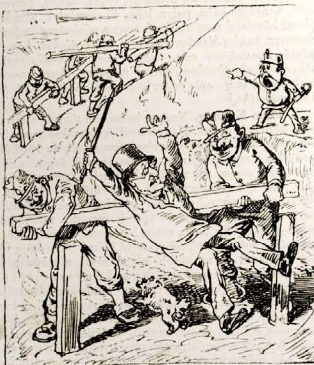
Várhegy oldalában jó régi korlát van, Fáradt öreg ember neki dülhet bátran. Hanem éppen akkor hogy rá támaszkodnék: Hős kommandó-szóra bontják-viszik onnét.