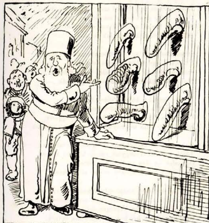
Az omladina hosszú orrokat.