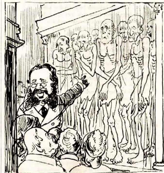
Szél Kálmán az új adótörvények hatását élőképekben.