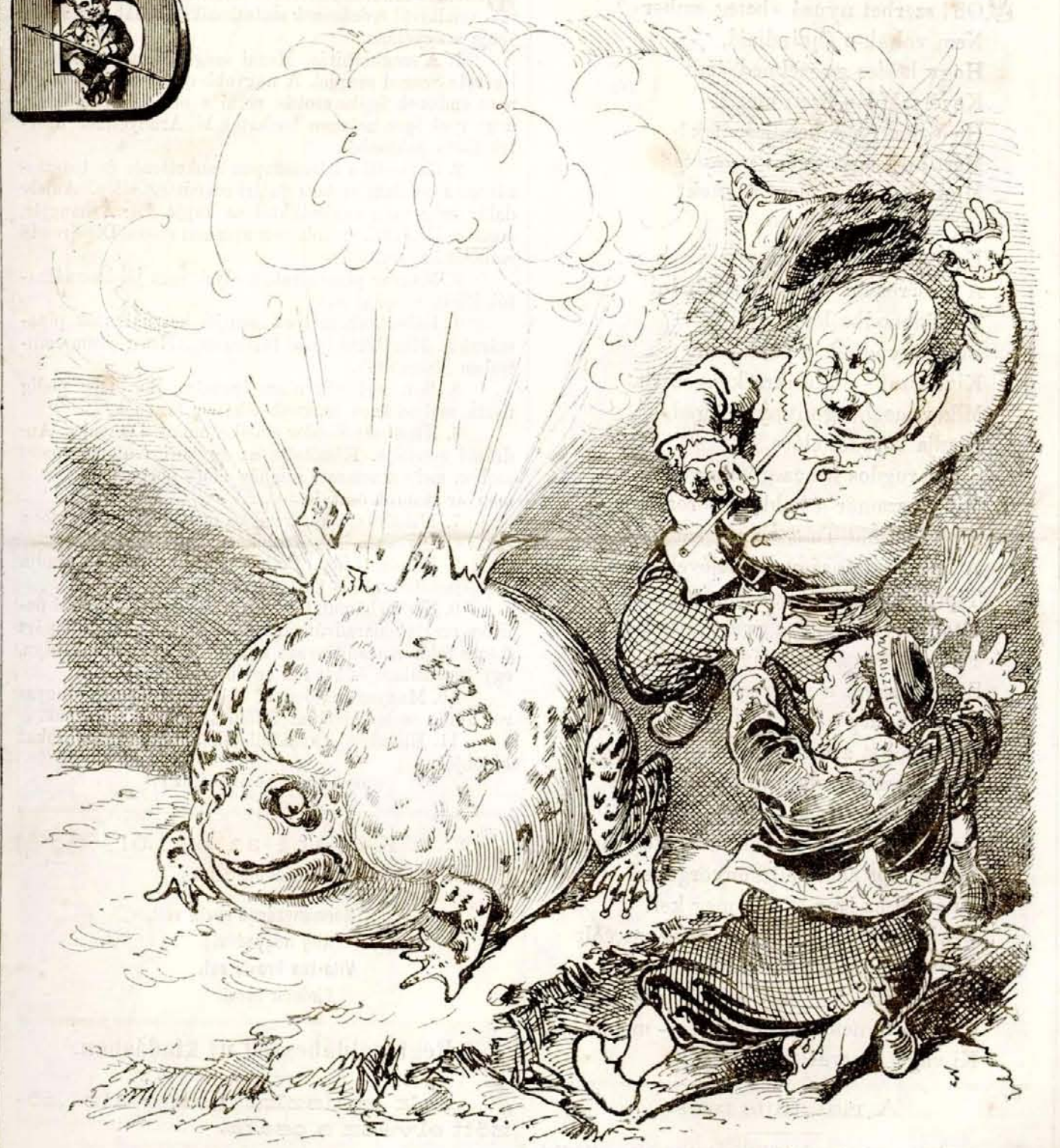
Tyú! Egy kicsit nagyon is föltaláltuk fujni!

Előfizethetni a kiadó-hivatalban: Budapest, Ferenciek-tere 7. sz. Előfizetési díj: Egész évre 8 frt. — Félévre 4 frt. — Negyedévre 2 frt. Egyes szám 10 kr.