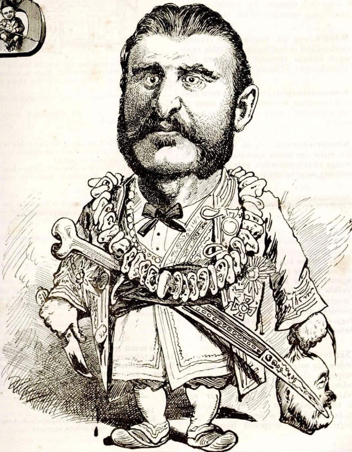
Nikita, Montenegro fejedelme.