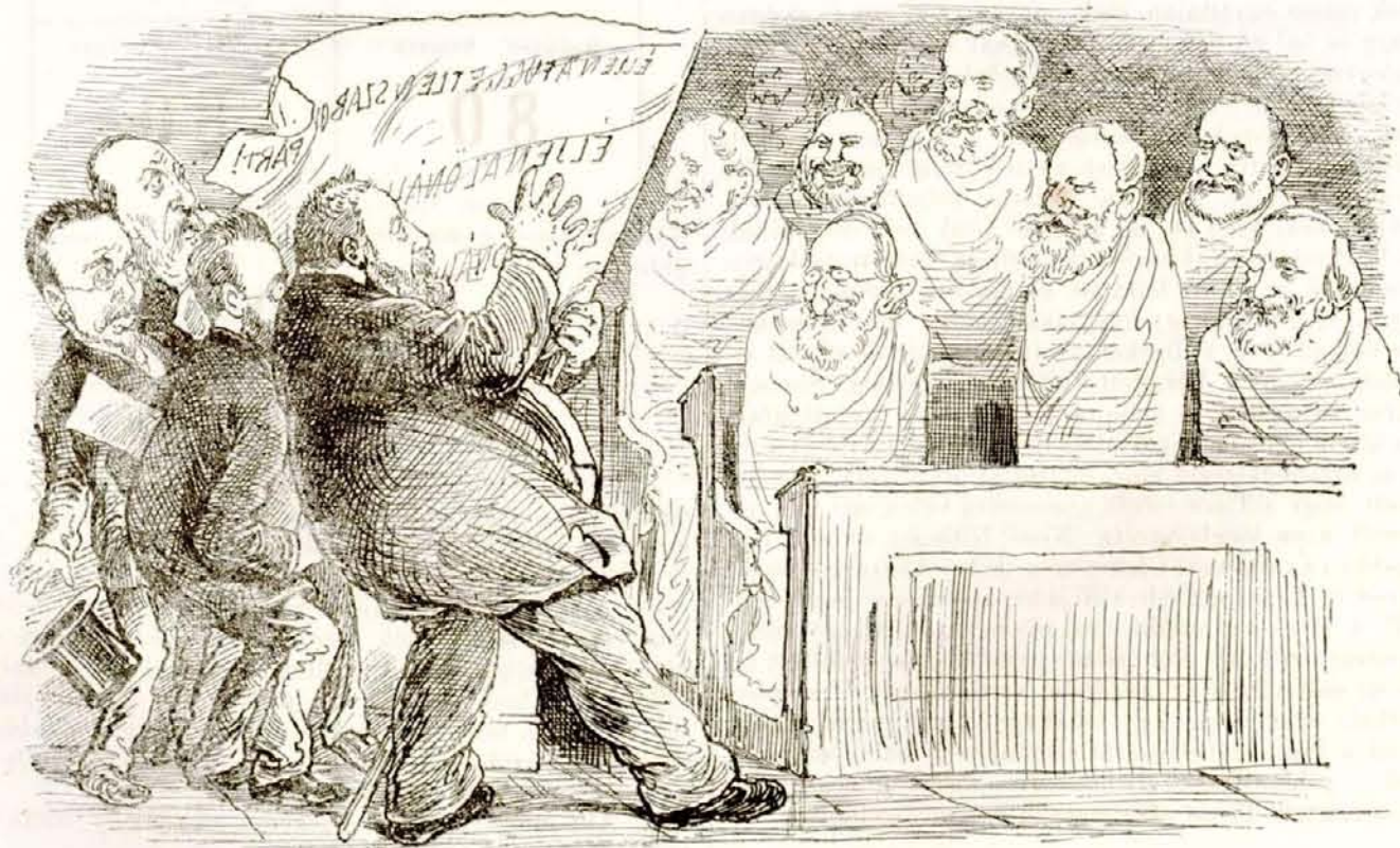
P—y. Huh! A kisértetek! Ha ezeknek meddősége találna belénk ütni!...