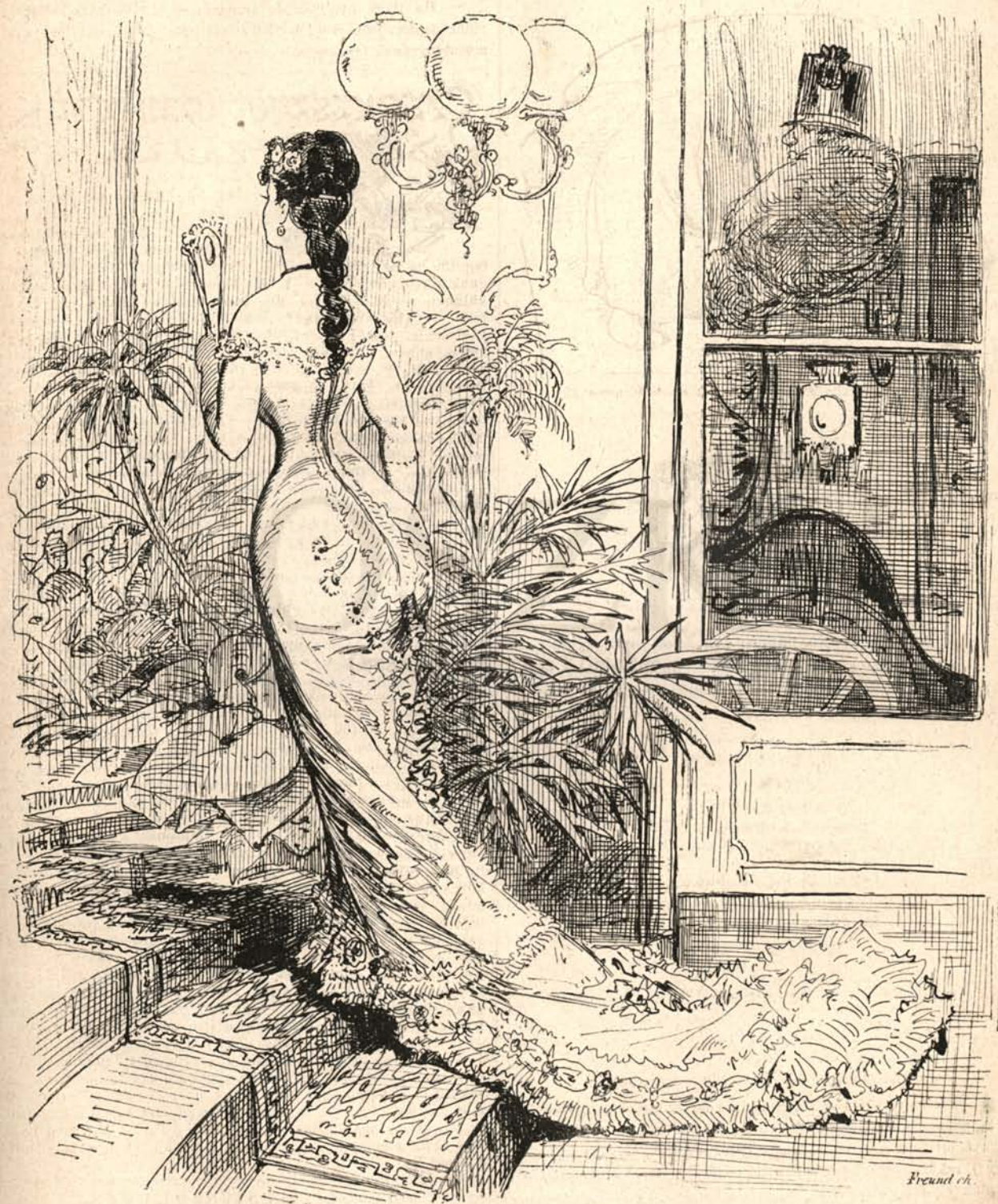
Csodás évszak! Egy üveg ajtó választja el a bundás északi sarkot a pálmás egyenlítőtől.