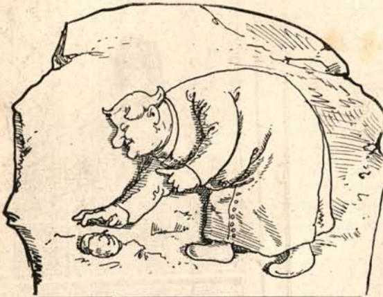
(R. F. megtalálja Milton elvesztett »paradicsomát.«)