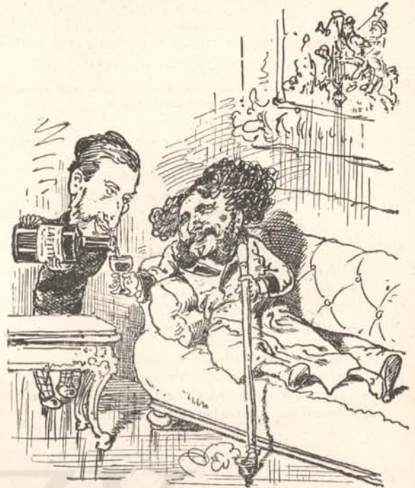
Szerenese, hogy kutya baja.