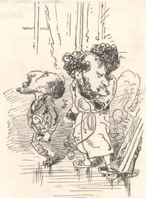
Sajog a lába —