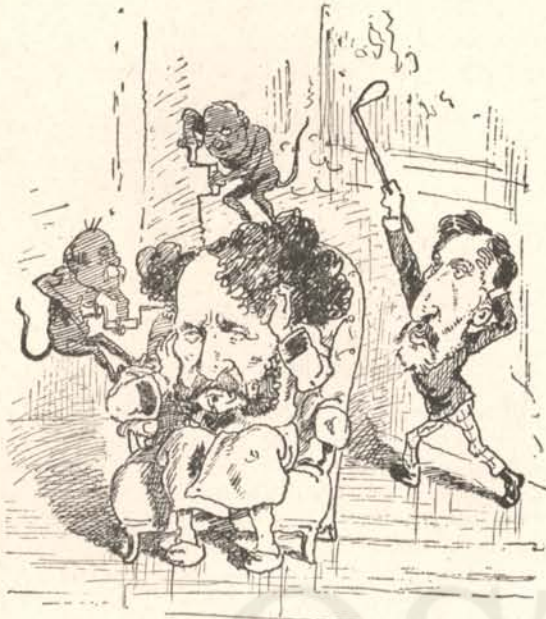
Fáj a feje nagyon.