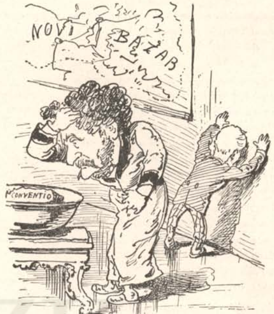
Émelygeti a gyomrát a Conventio- csömör.