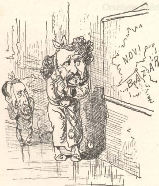
A foga is fáj — arra a Novi-Bazárra.