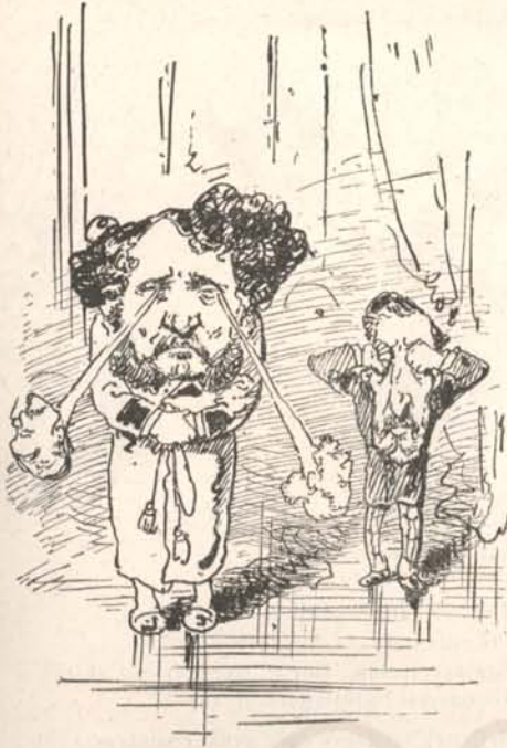
— és a szeme. Szálka van benne.