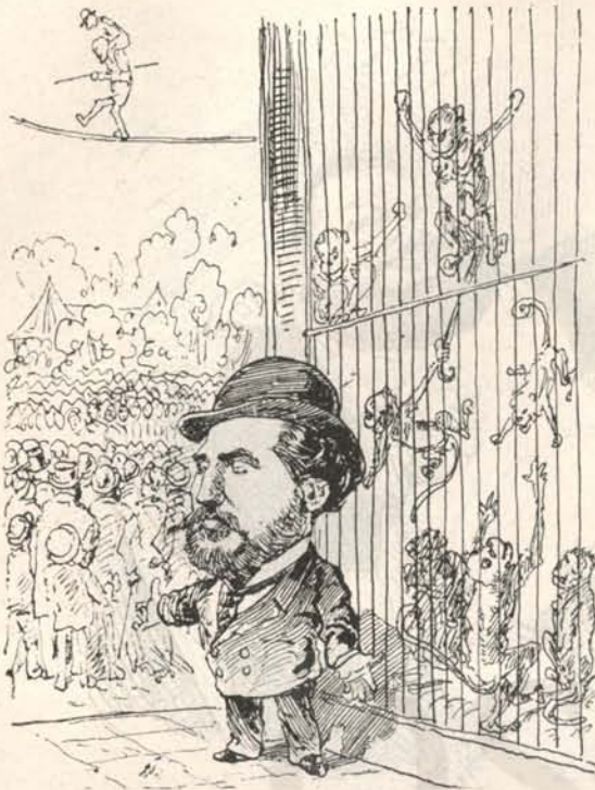
Az állatkert igazgatója. Az én majmaim százszor különbet cselekszenek, mégis azt az egyet bámulják.