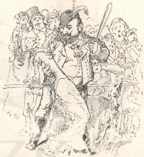
— Meg hogy ippeg az én karjaimba köll bele szidünije ennek a meddő Kotlóának.