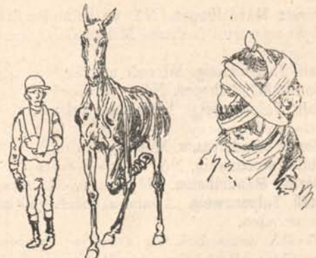
Jockey-nóta szöveg nélkül.