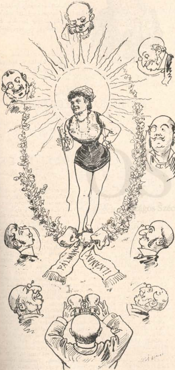
A nap és holdjai.

»Nap és Hold« kitünő operette, de csak felnőtt apák számára. Ezt reklámul írjuk ki. Hányan sietnek a színházba,