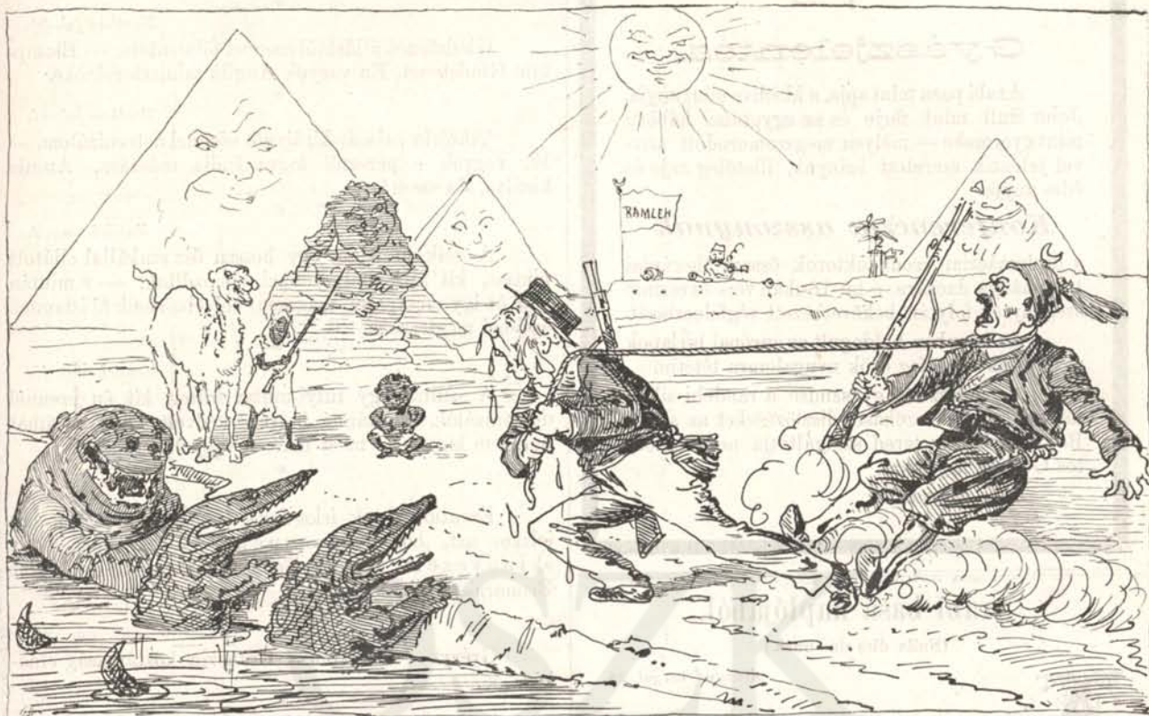
Angol. „Fogtam törököt, de — viszem.“