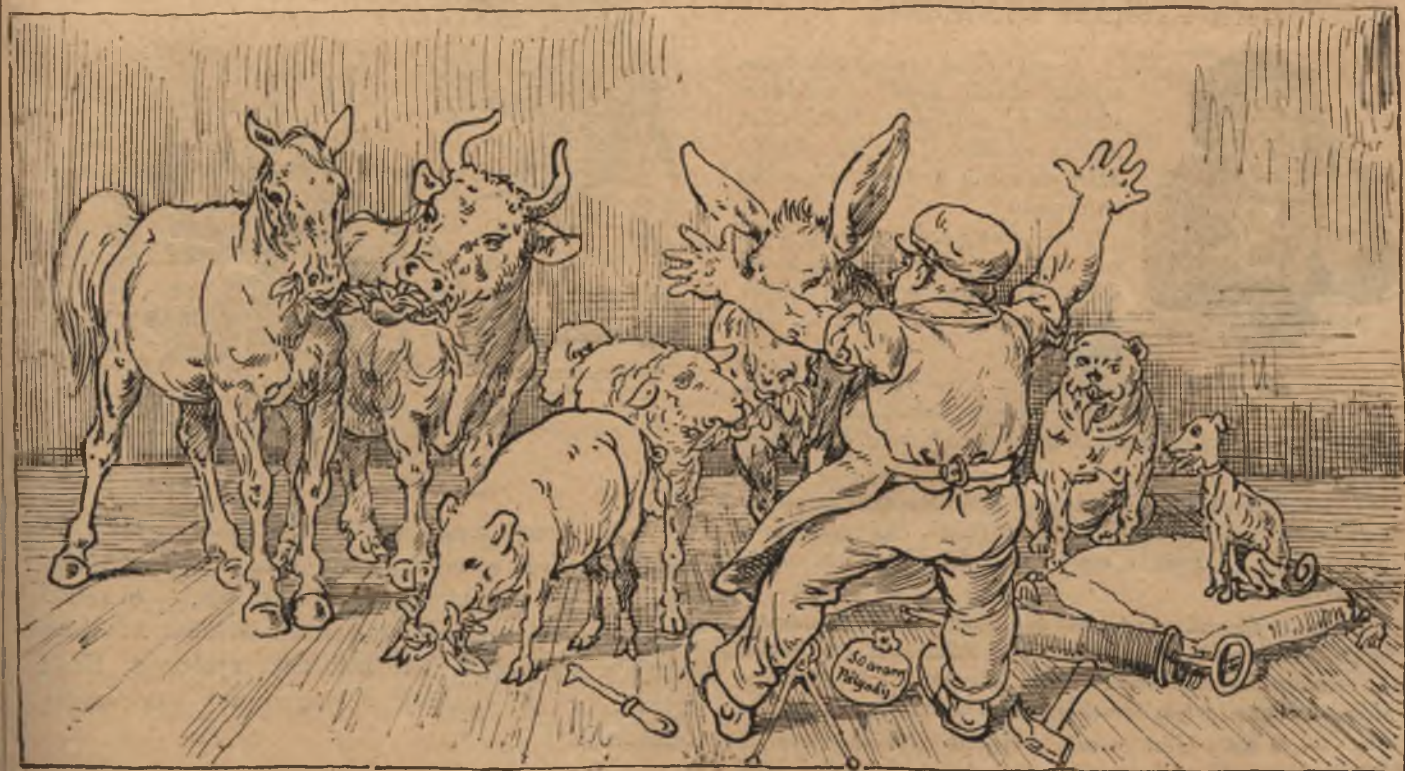
— hogy az ünnepség után mind megették a borostyán-koszorút.