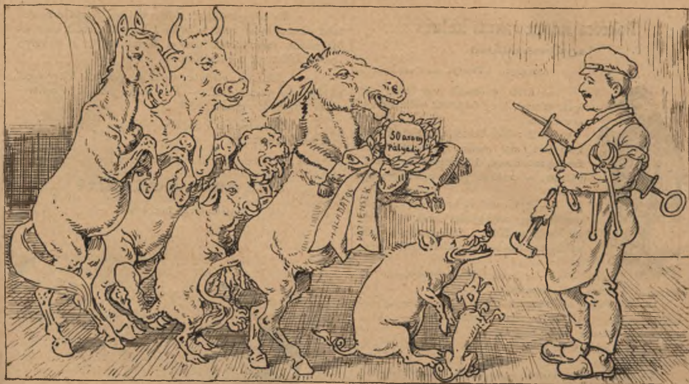
A kikúrált páciensek hódolata az ő mesterük iránt. Olyan jól érzik már magukat —