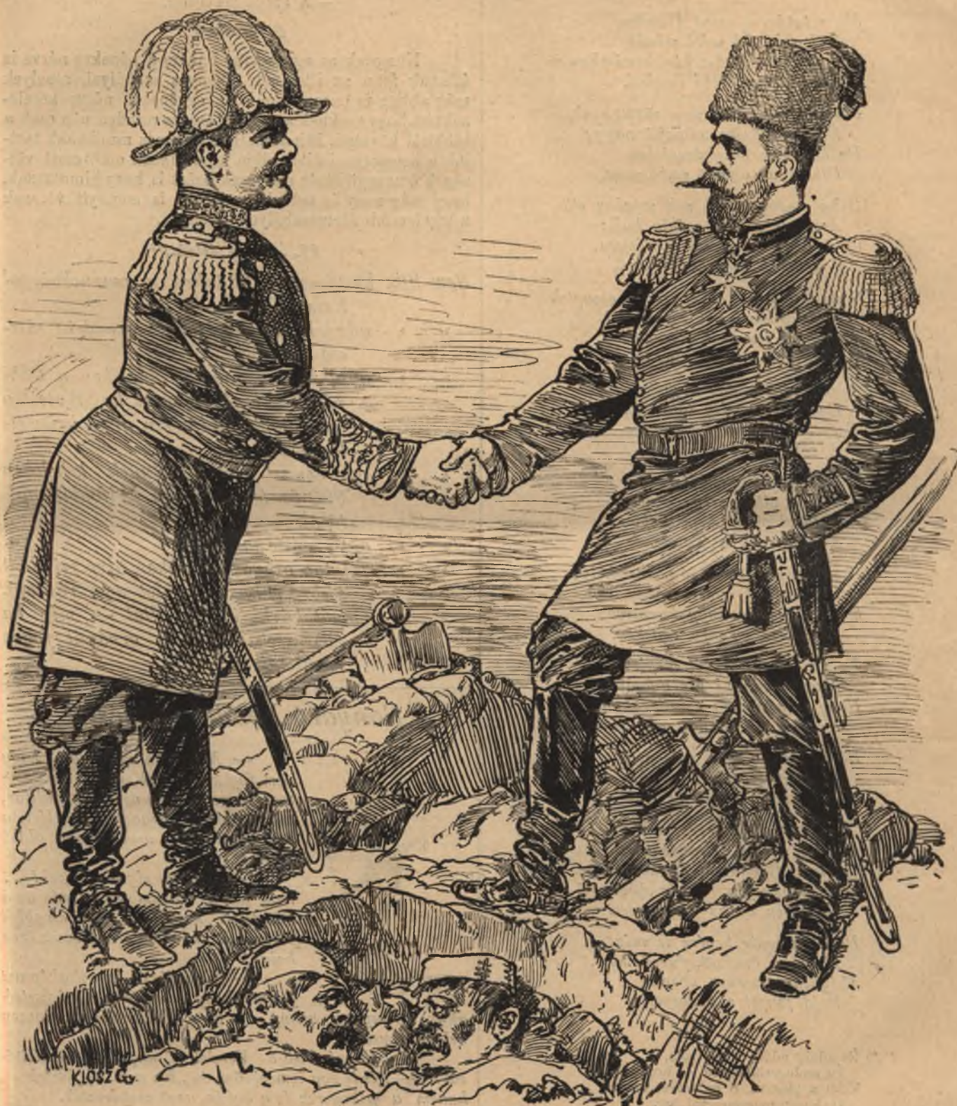
Szerb katona (a bolgárhoz.) No pajtás, ezért ugyan kár volt hasba lönünk egymást!