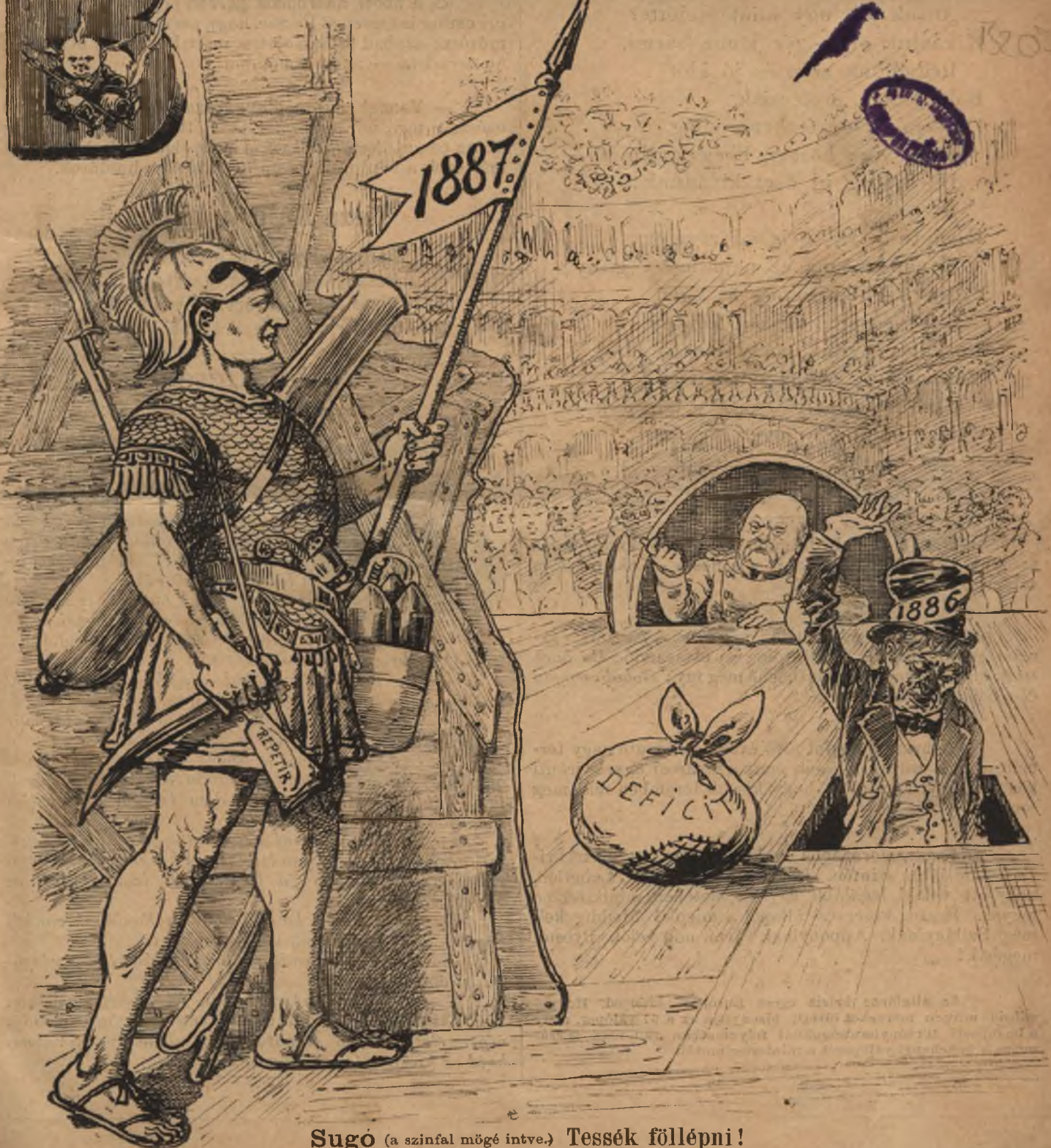
Sugo (a szinfal mögé intve.) Tessék föllépni!

Előfizethetni a kiadó-hivatalban : Budapest, Ferenciek-tere 3. sz. Előfizetési díj : Egész évre 8 frt. — Félévre 4 frt. — Negyedévre 2 frt.