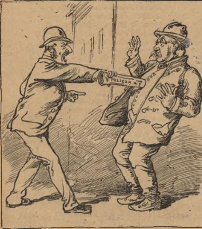
Biztosító ágens. — Életedet, tüzedet, jegedet!