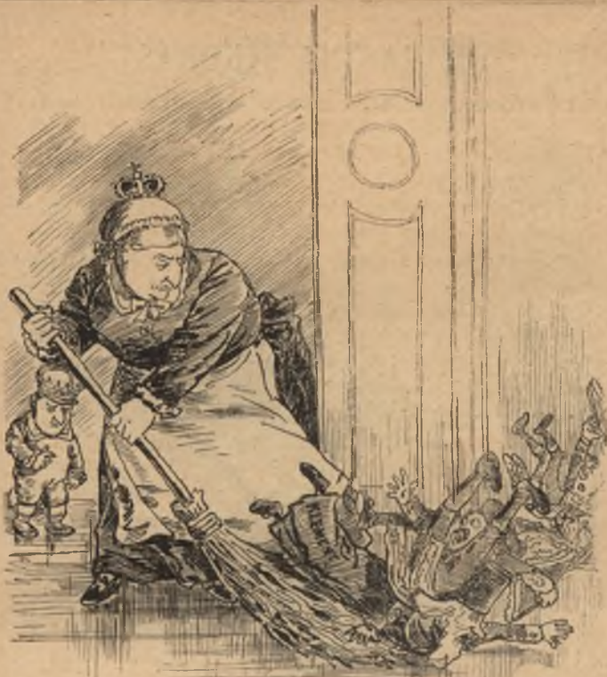
Szemetes a kabinétod, Ferdikém, A seprővel hajh! — ezt is kisepreném.