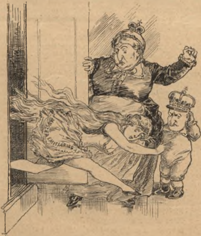
Hát a kasznyi? Mi van benne, mutasd hát! Ejnye, azt a sanzonettes kis fruskát!