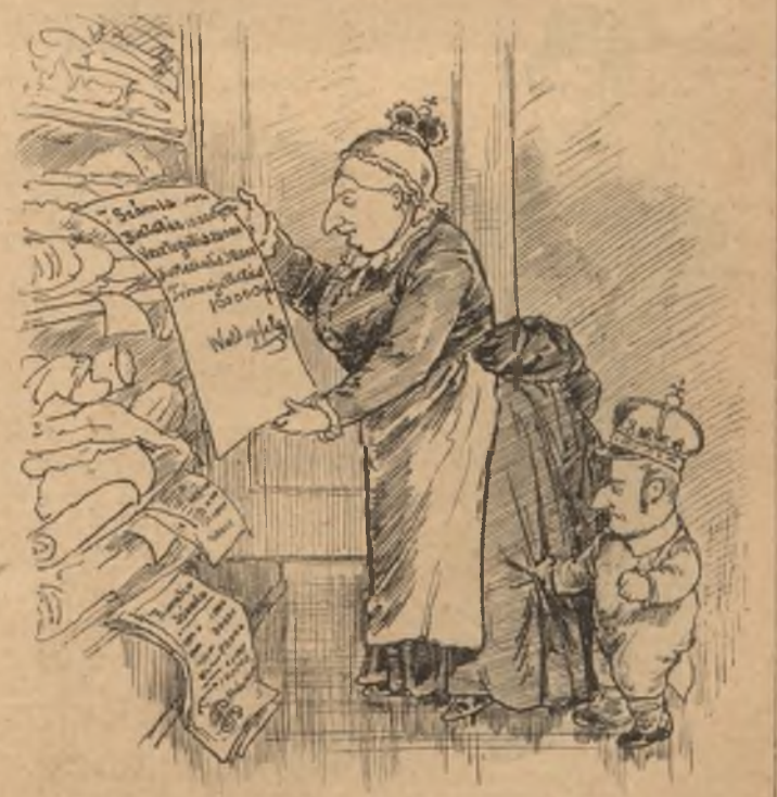
És a szennyes? Húzd ki csak a főköd — Ó mit látok! Tróncsináló zsidókat!