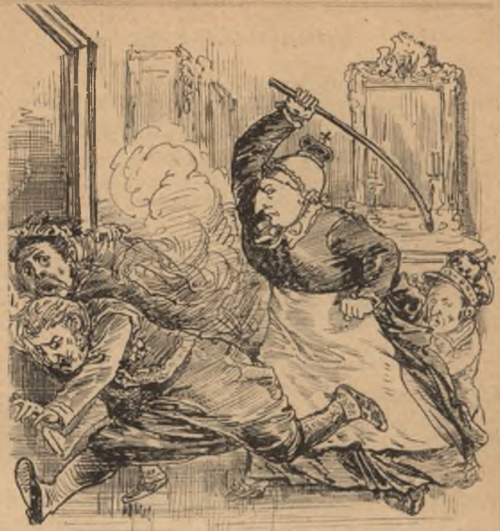
Ruháid is mind porosak, angyalom Legényeid hátán majd kiporolom.