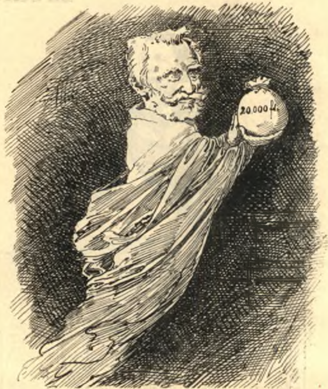
— a hazajáró jótét lélek.