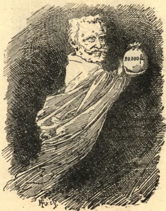
— a hazajáró jótét lélek.