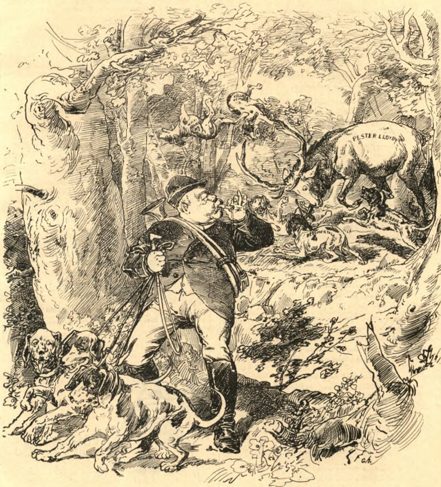
B—ck visszafütyenti az ő kutyáit, észrevévén, hogy idegen területen jár az ő falkájával.