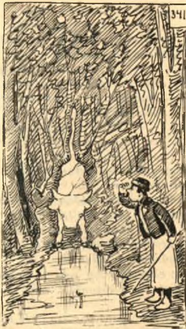
Mednyánszky László b. A rém tehén, vagyis a hazajáró Virág. A kísérteties belga Vierz s a spanyol Benlliure — magyarúl. Mert mindenek előtt magyarok legyünk, messieurs!