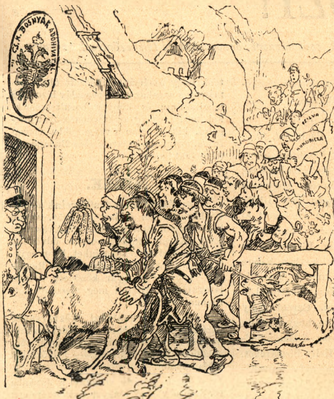
Az adófizetés napja.