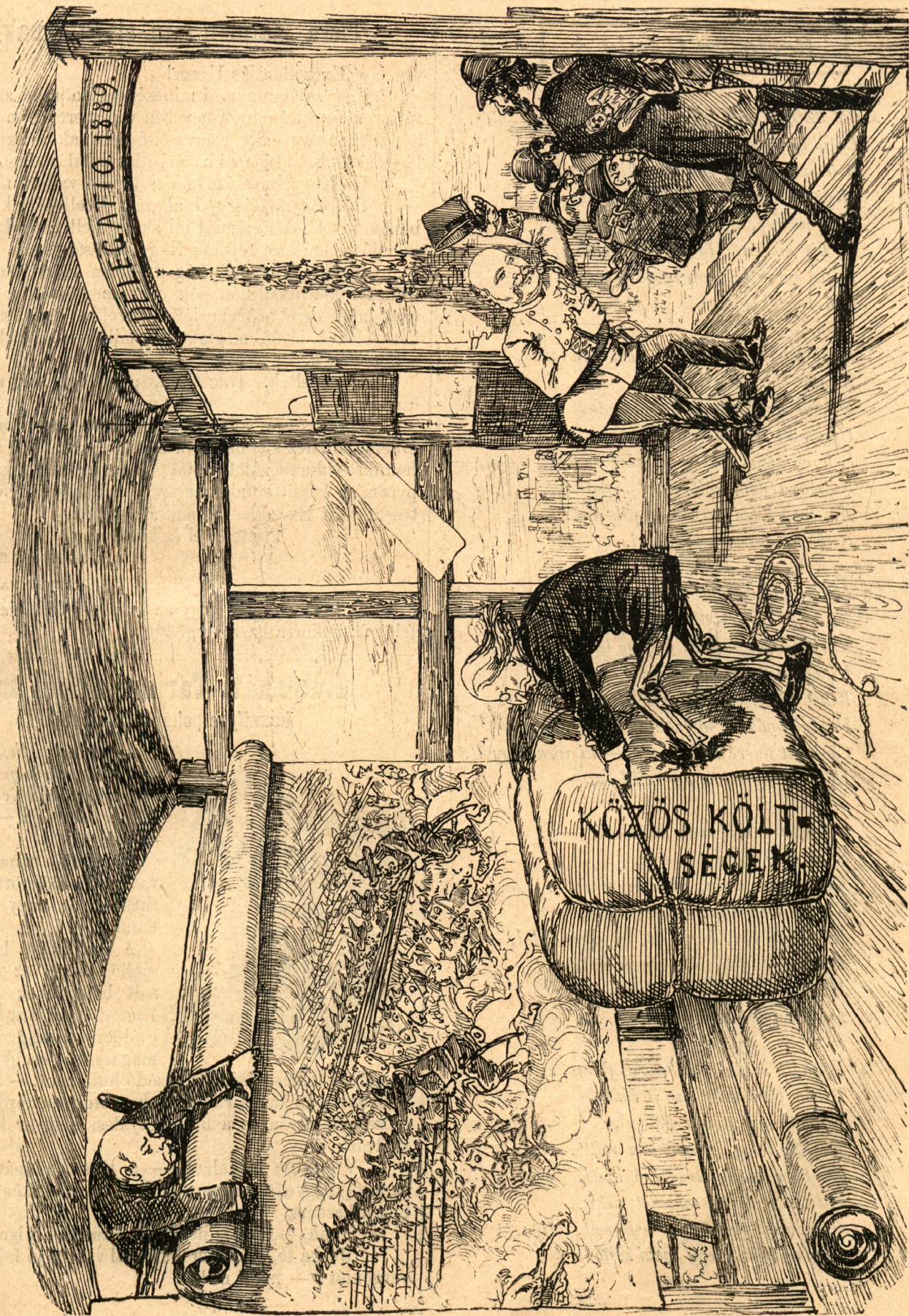
B-r. Magamat ajánlom. Mások is legyen szerencsém.