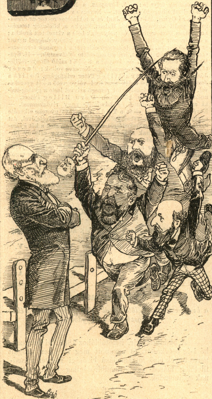
Turinből nagy garral hozzák, Hogy majd Tisztát megbotozzák —