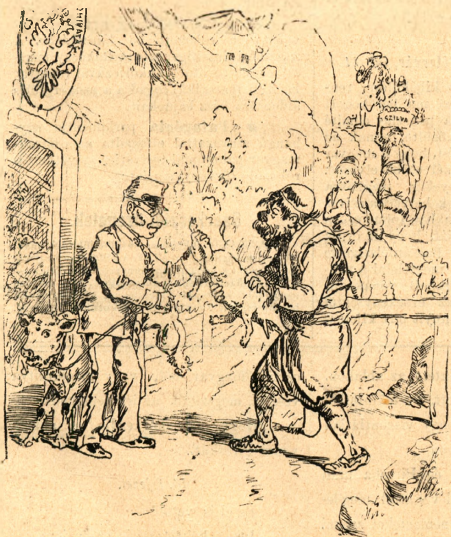
A borjuból vissza is jár még valami.