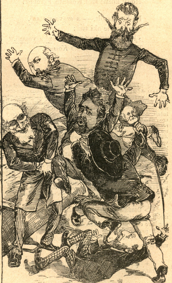
S közbetoppan Kossuth Feri... S azt a vesszőt rájuk veri.

Előfizethetni a kiadó-hivatalban: Budapest, Ferencziek-tere 3. sz. Előfizetési díj: Egész évre 8 frt. — Félévre 4 frt. — Negyedévre 2 frt.