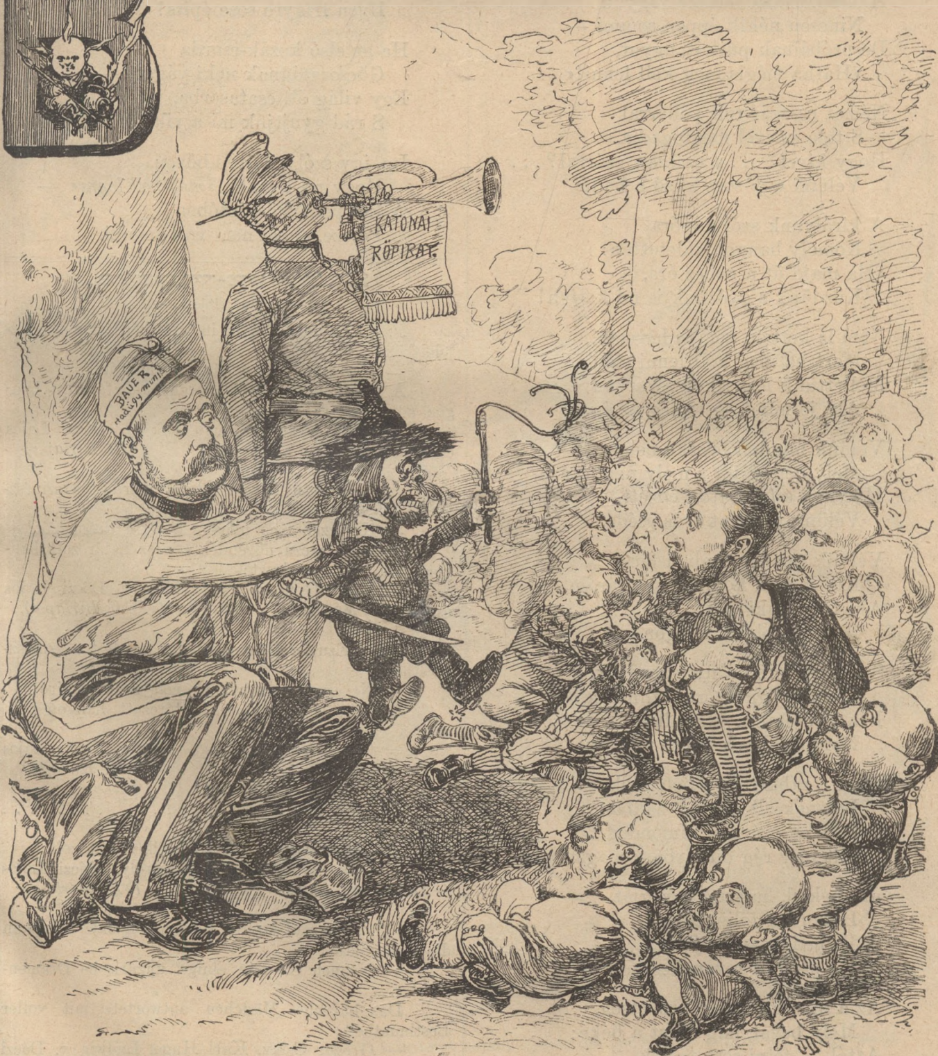
Az a bizonyos mumus.

Előfizethetni a kiadó-hivatalban : Budapest, Ferencziek-tere 3. sz. Előfizetési díj : Egész évre 8 frt. — Félévre 4 frt. — Negyedévre 2 frt.