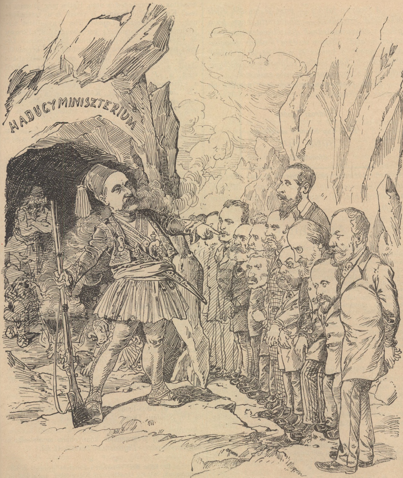
Athanáziosz Baueropólosz csak 20 millió váltásért hajlandó szabadon bocsátani a megrémült delegátusokat.