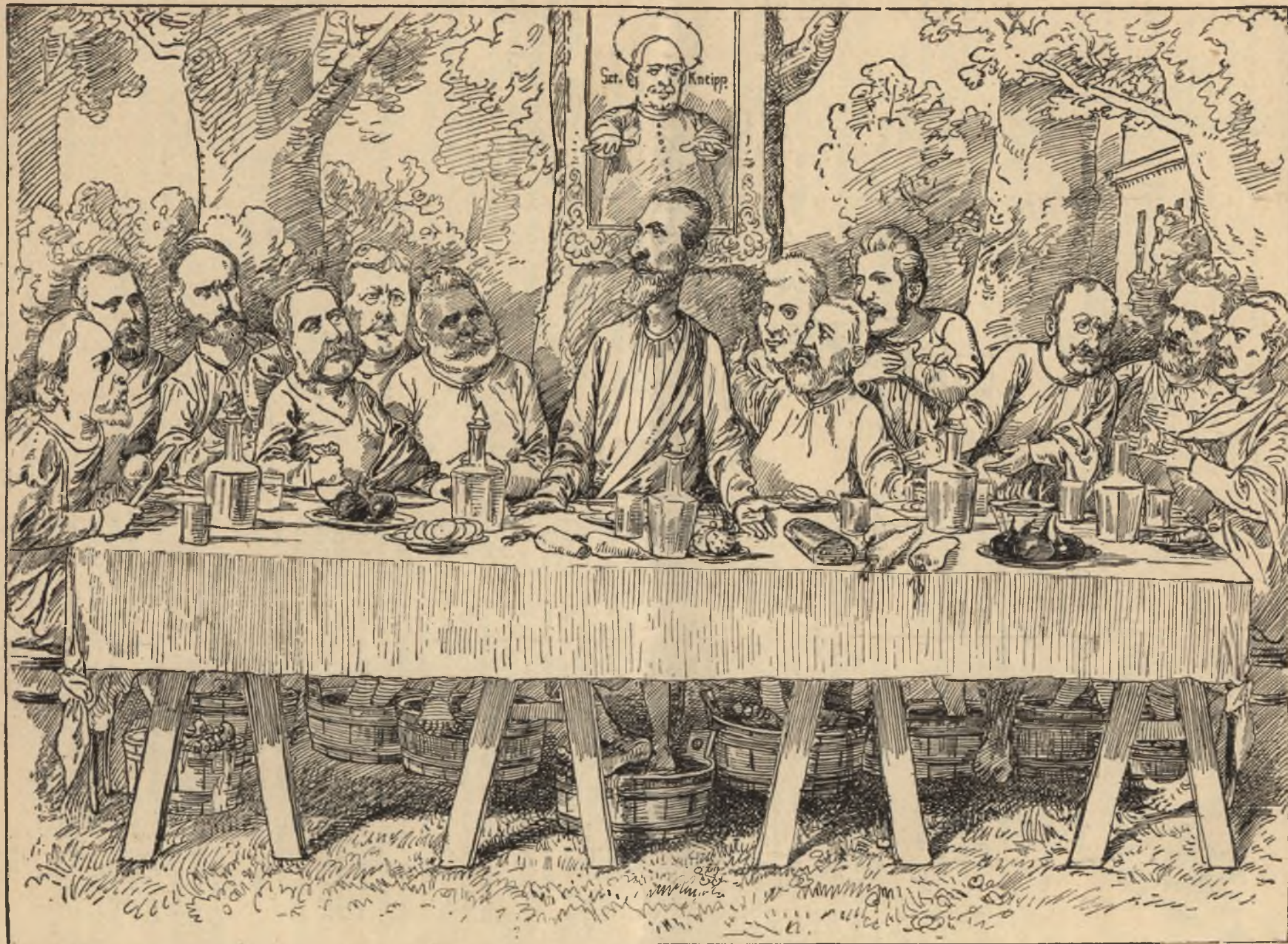
Ur vacsorája a Margit-szigeten.