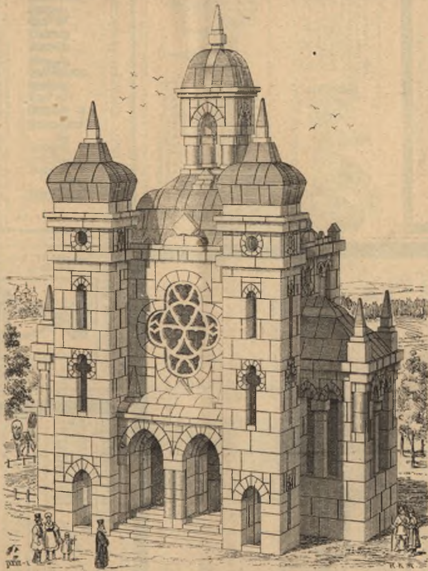
Felépített egy Horgony-Kőépítőszekrénytel.

Mindazon kőépítőszekrények, melyek csomagolásán a „Horgony“ grárjegyi hiányzik , közönséges és kiegészítésre teljesen értéktelen utánzatok; ennél fogva mindig kifejezetten: „RICHTER-féle Horgony-Kőépítőszekrények“ kérendők és csak azok fogadandók el; mert ezek eddig utólrhetetlenek és csak egyedül ezek egészíthetők ki tervszerűen. Nem kell magát tévútra vezetetni az által, hogy nyilván-