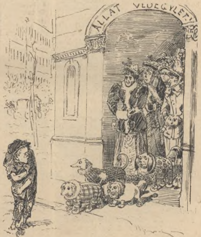
Koldusgyerek. — Mért nem vagyok kutya!