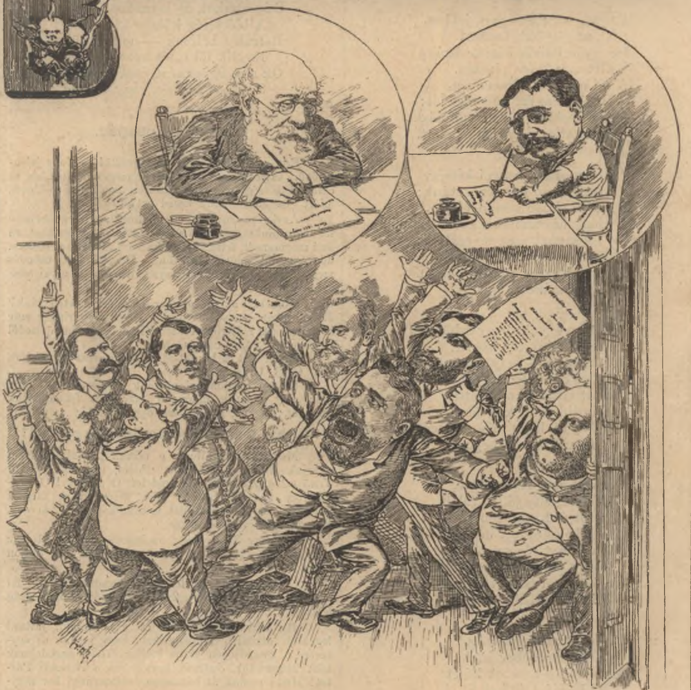
Lajos helyett Lulu.

Előfizethetni a kiadó-hivatalban : Budapest, Ferencziek-tere 3. sz. Előfizetési díj : Egész évre 8 frt. — Félévre 4 frt. — Negyedévre 2 frt.