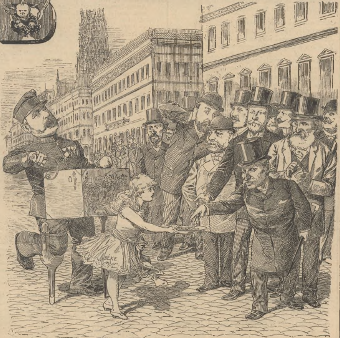
A régi bécsi nóta.

Előfizethetni a kiadó-hivatalban : Budapest, Ferencziek-tere 3. sz. Előfizetési díj : Egész évre 8 frt. — Félévre 4 frt. — Negyedévre 2 frt.