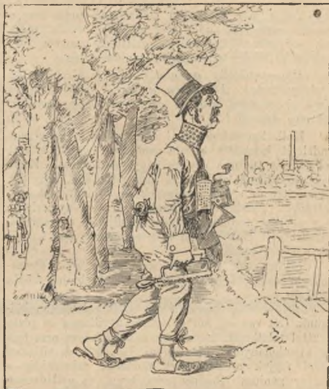
— és után.