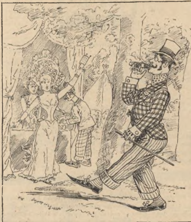
Vásár előtt —