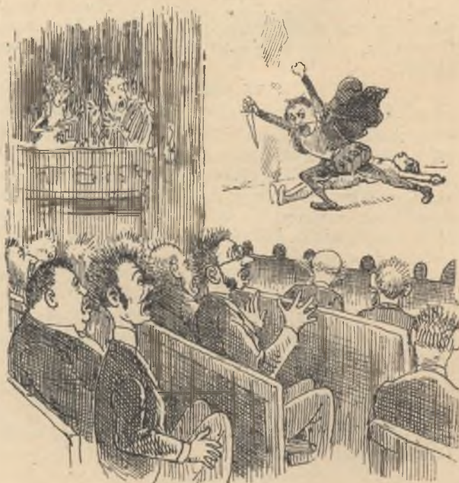
A színházban olyan rémdrámát ját- szanak, hogy a közönség hátán hideg borzongás fut végig.