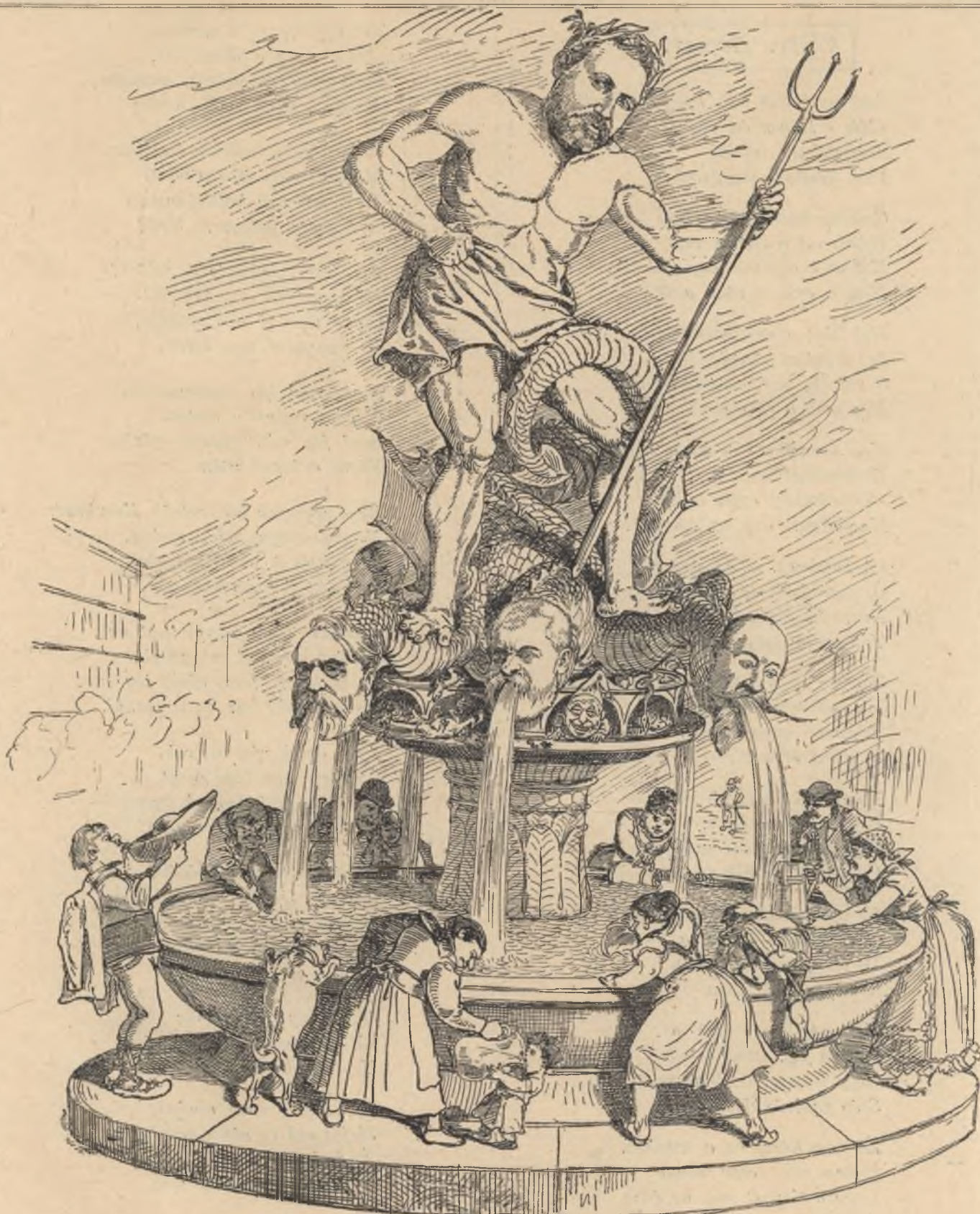
A fővárosi új vizmü.