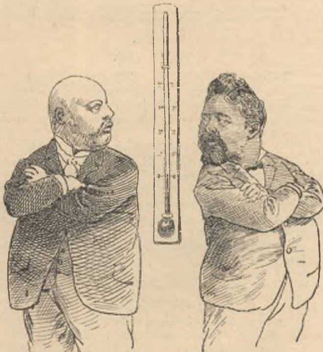
A legnagyobb elhidegülés.