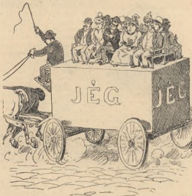
Omnibus jeges szekrényen.