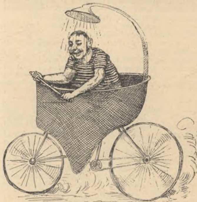
Fürdővel kombinált veloczipéd.