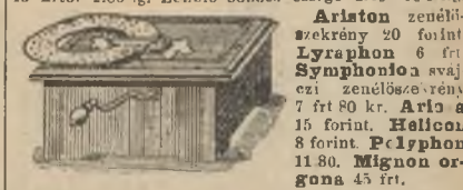
Minden zenesekekrény árában 6 zenedarab van beleértve.

9 frtig. Képeskönyv 60 krtól 3 frtig. Zenélő doboz frt 1.170—2.50-ig. Dülejes uszó állatok 25 kr. 2.50-ig. Gyerm- mekszínház szindarabokkal magyar szöveggel frt 3.— Fűszerkereskedés 4 frt. Hegedű 1.50. Festék-szokony 50 krtól 4 frtig. Kocza játék 6 képpel 60 krtól 3 frtig. Amerikai préselethajlító 1.15—1.80 ig. Büvéz- készlet 40 krtól 9 frtig. Lombfűrés készlet 6—14 frtig. Laterna magika 80 krtól 20 frtig. Amerikai ajtó közé va ó to-nakészlet 9.50—10.50-ig. Hajlépítész 5 frt. Kagyló munkálat 3.30 a kis modeler 4.85. Fecskendőtűszet 1.80—5.50-ig. Richter-fé éplé iskola kövekkal felállítható figurákkal 80 krtól 1 fr- rtig. Csöbök 30—50 krig. Sivító gummi játéka o e- 40 krtól 2.80-ig. Zenélő bohócs csörgő 2.40—10 f tfg.