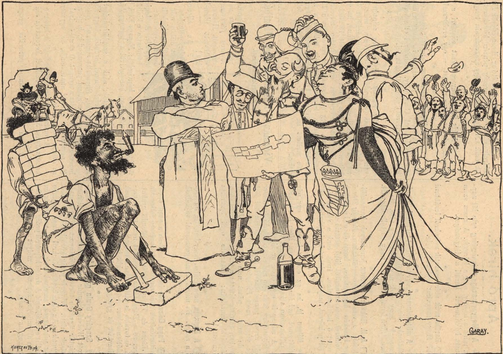
I. A kiállítási góré alapványog-letétele.