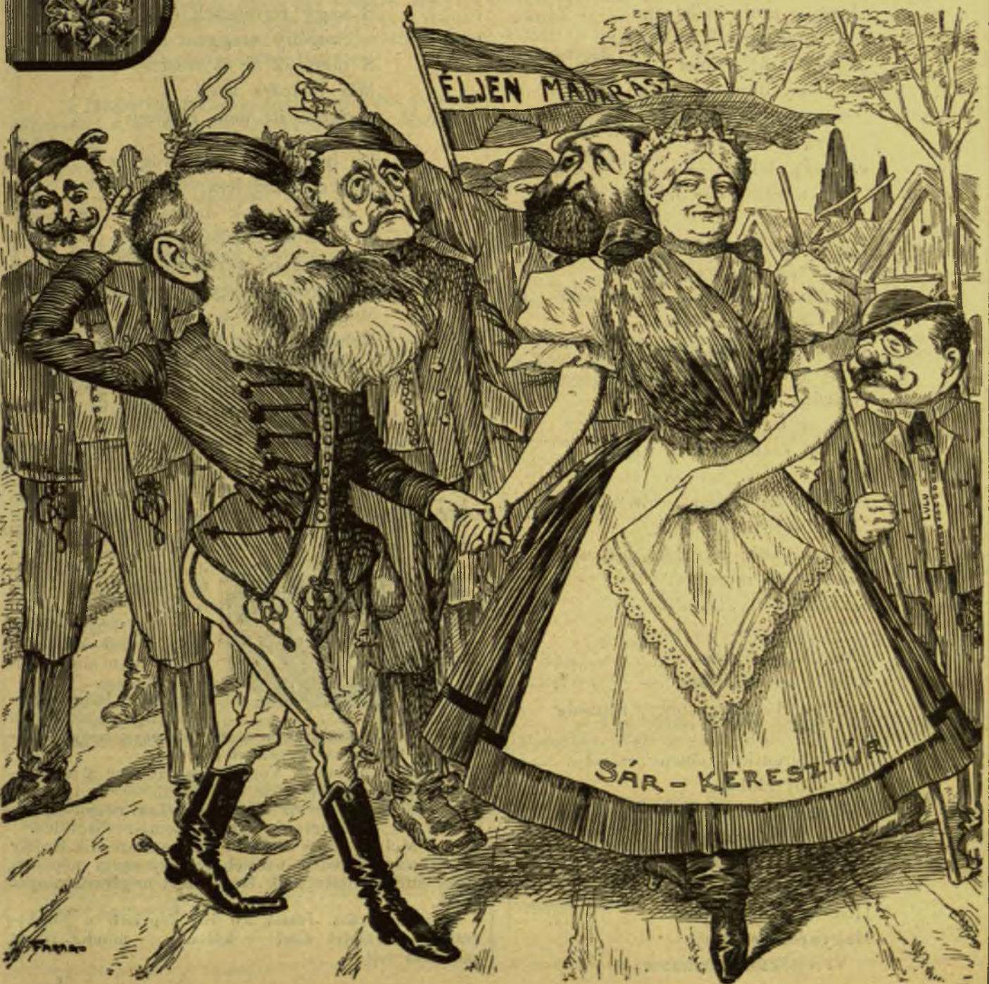
Derék, tiszta ember az öreg, méltó is a feleségéhez.

Előfizethetni a kiadó-hivatalban: Budapest, Ferencziek-tere 3. sz. Előfizetési díj: Egész évre 8 frt. — Félévre 4 frt. — Negyedévre 2 frt.