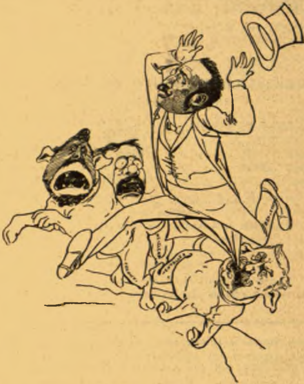
B—viczy előtt így ...