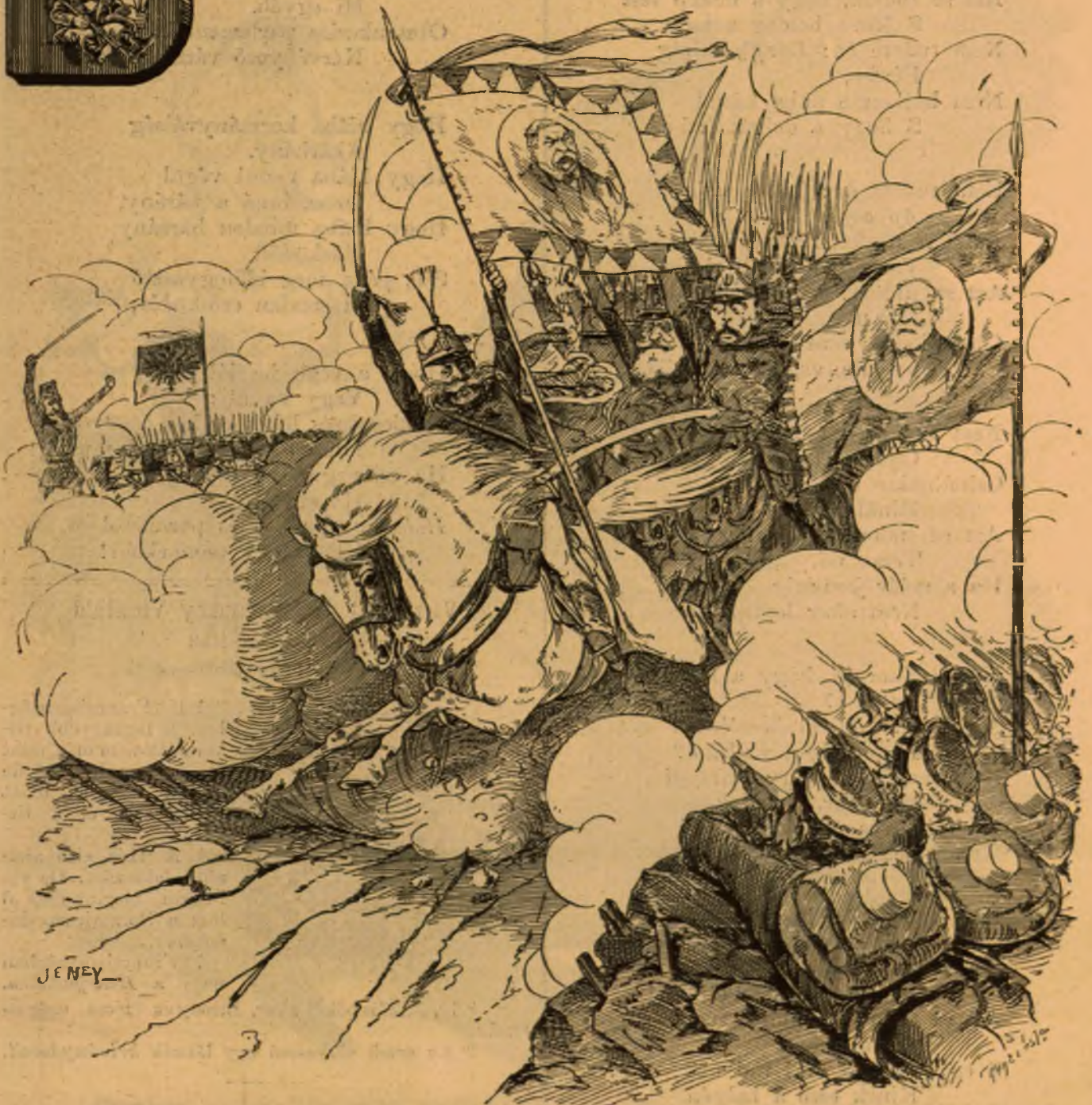
A Deák-huszárok két tűz között.

Előfizethetni a kiadó-hivatalban: Budapest, Ferencziek-tere 3. sz. Előfizetési díj: Egész évre 8 frt. — Félévre 4 frt. — Negyedévre 2 frt.