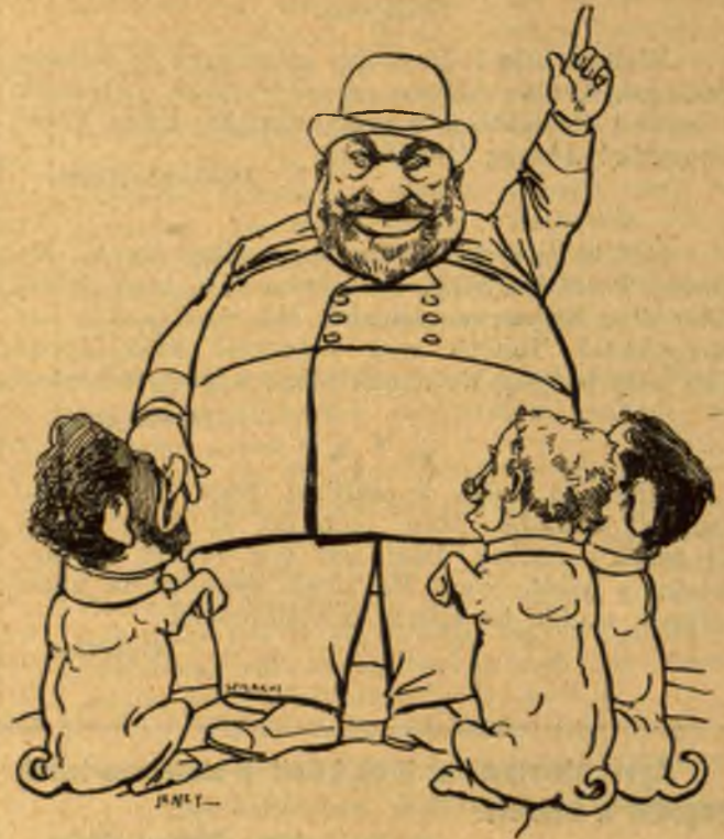
... Sz—gyi D. előtt meg így.