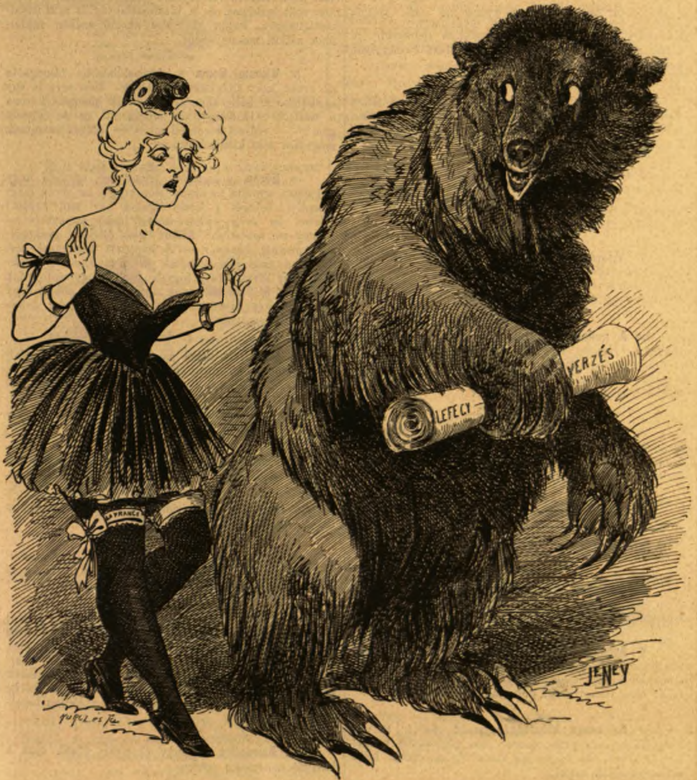
Uruskov. — Így tán csak lerázom a nyakamról ezt a törleszkedő fruskát!