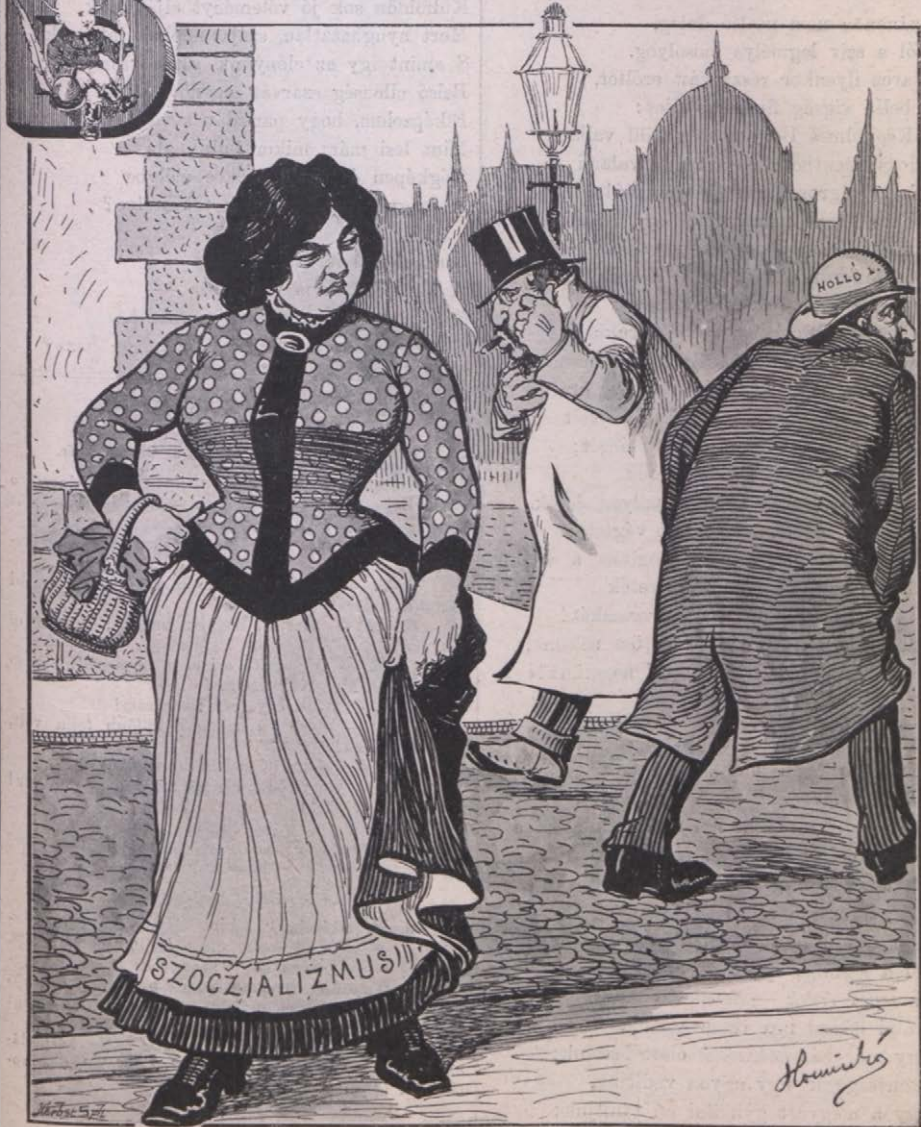
Szociziliszka. — Hm! Hát egyiknek se köllök?

Előfizethetni a kiadó-hivatalban: Budapest, Kerepesi-ut 54. Előfizetési díj: Egész évre 16 kor. — Félévre 8 kor. — Negyedévre 4 kor.