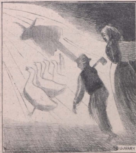
Tehén, libák, a pásztorgyerek és a kosaras asszonynak mennyemenetele.