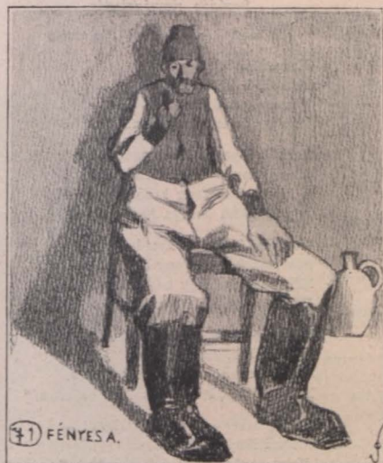
A fotografus tréfája, vagy a hétmérföldes csizma.