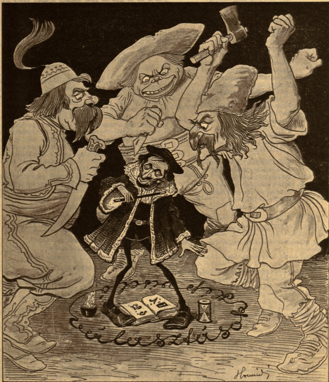
A. Gy. gróf. — Földéztem a kártékony szellemeket s most nem tudok nekik parancsolni.