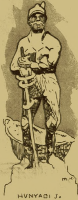
HVNYADI J. m.k.