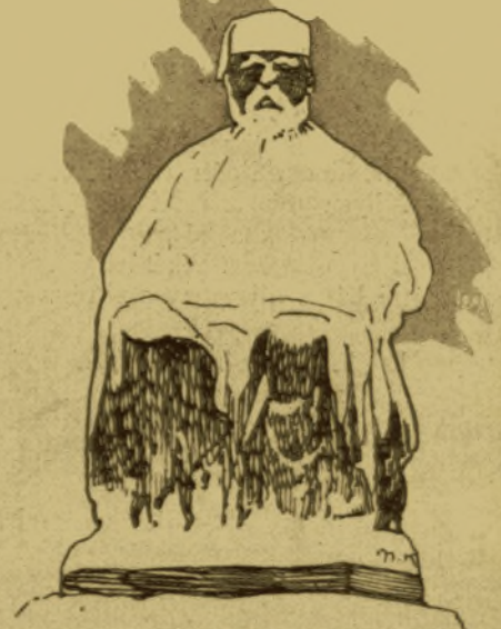
DEAK F. m.k.