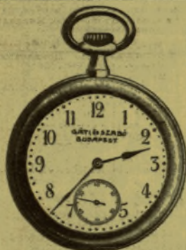
BJ. 10. számú „Gentleman Präciós óra.”