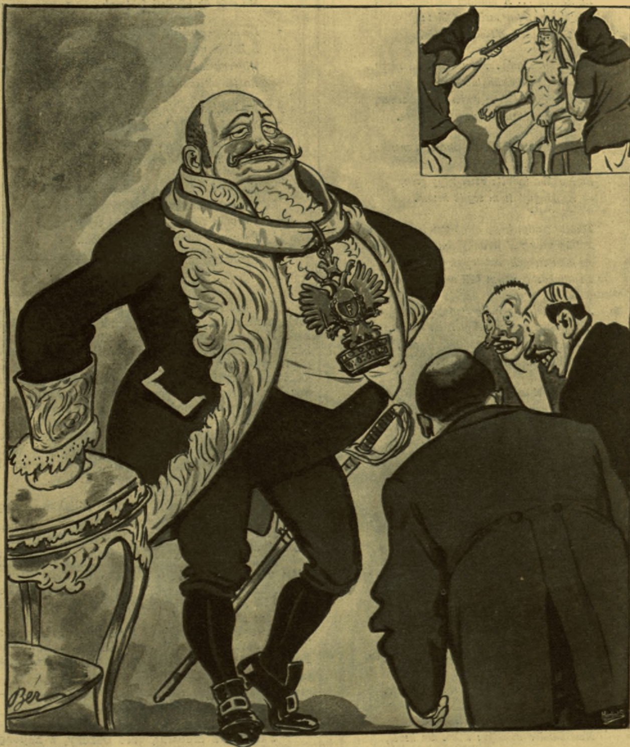
I. A Dózsa Györgyé. II. A Kossuth Ferenczé.