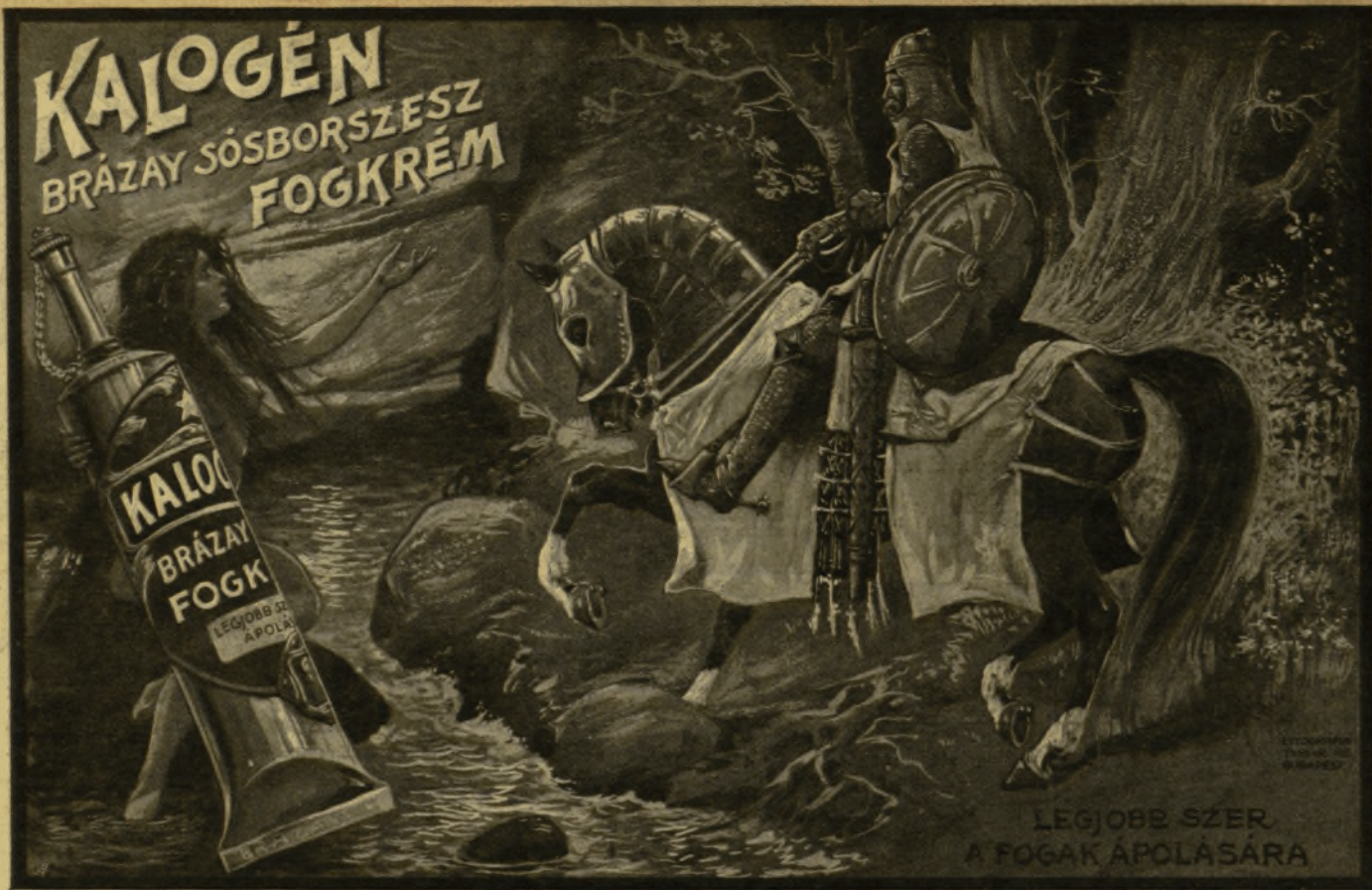
LEGJOBB SZER A FOGAK ÁPOLÁSÁRA