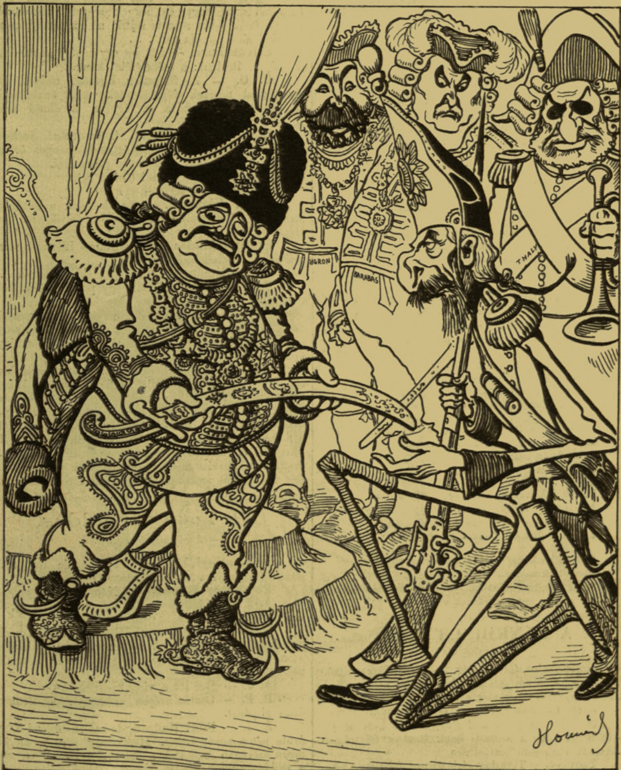
Francesco primo, gerolsteini nagyherceg. — »Fogd ezt a kardot, A kardot, a kardot, Melyet egykor Hős apám viselt.«