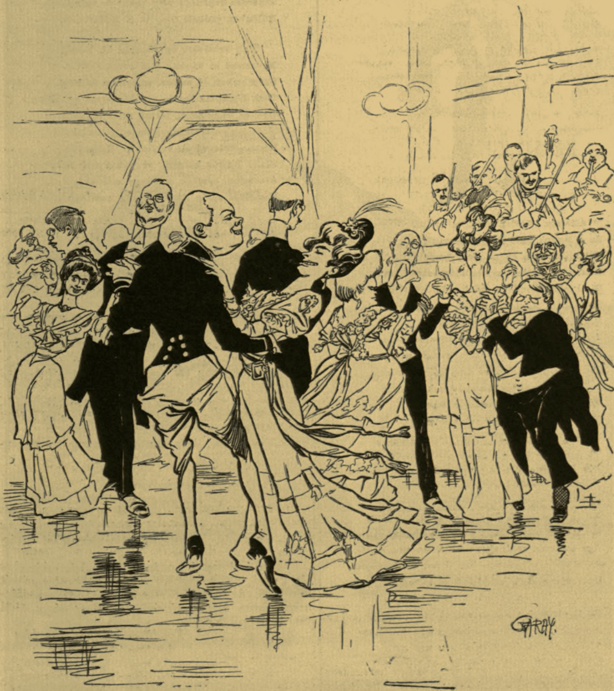
A dzsenti-bosztón, tulipános nemzeti táncz.